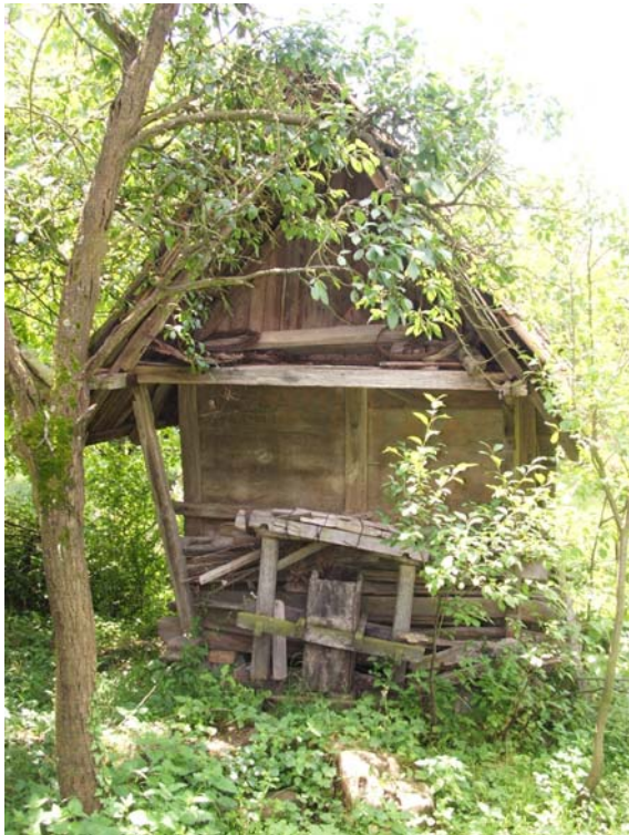
Sl. 11. Hambar