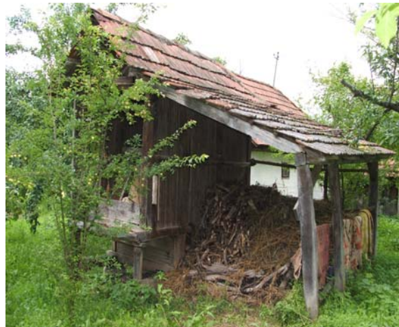
Sl. 12. Koš za kukuruz