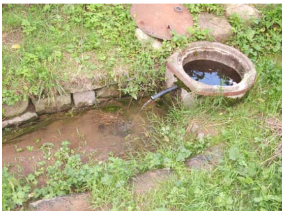
Sl. 13. Bunar