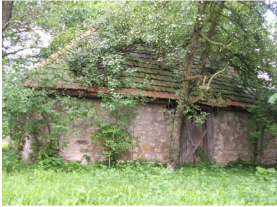
Sl. 9. Pušnica