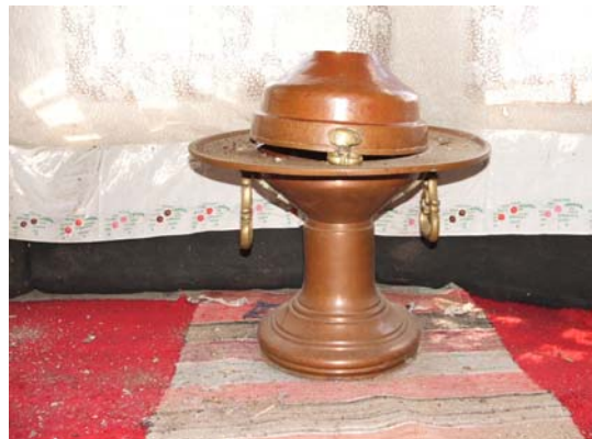
Sl. 6. Mangala