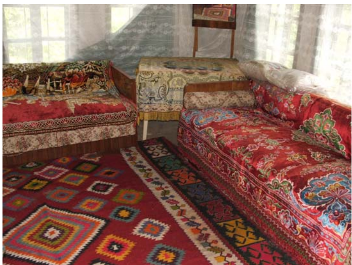
Sl. 8. Unutrašnjost sobe