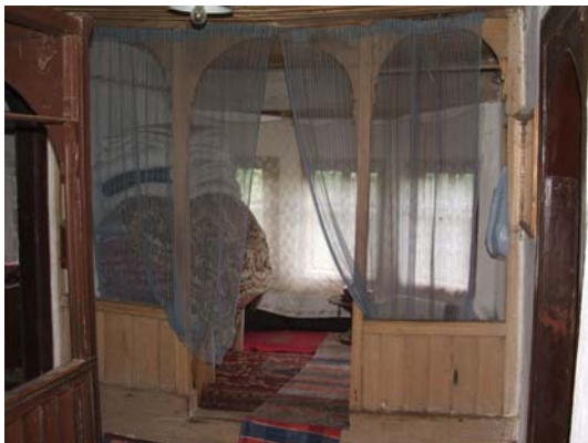
Sl. 5. Unutrašnjost divanhane