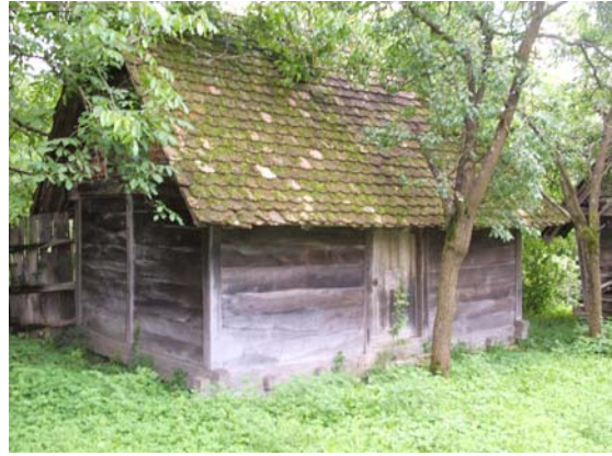
Sl. 10. Magaza