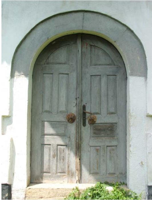
Sl. 3. Ulazni luk