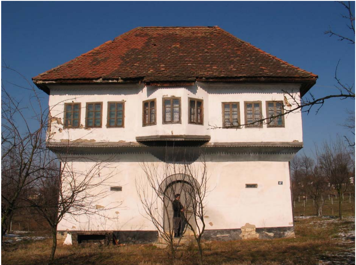
Sl. 2. Pogled na begovsku kuću