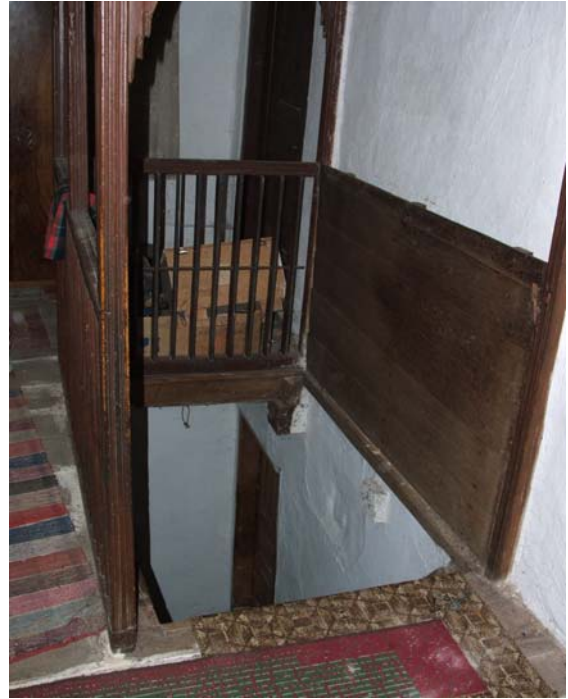
Sl. 4. Izlaz na čardak