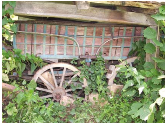
Sl. 14. Fijaker