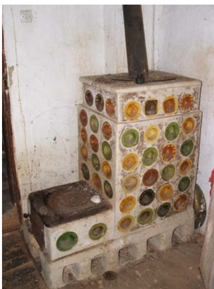
Sl. 7. Zemljana peć