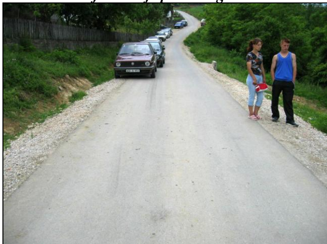
Gornji Čekanići dobili asfaltni put