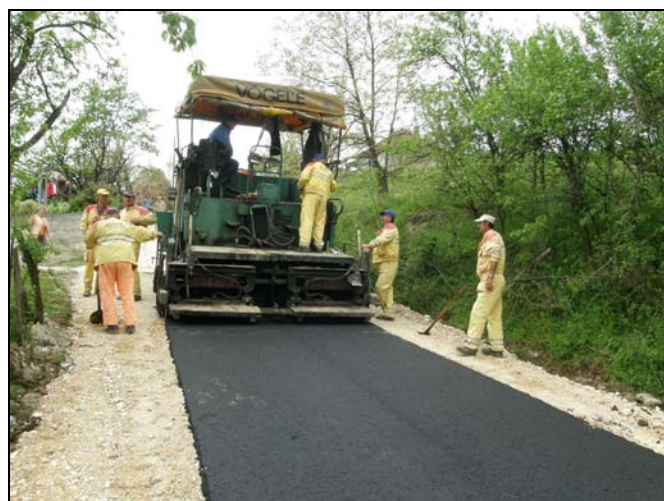
Gornjim Čekanićima 850 metara novog asfalta