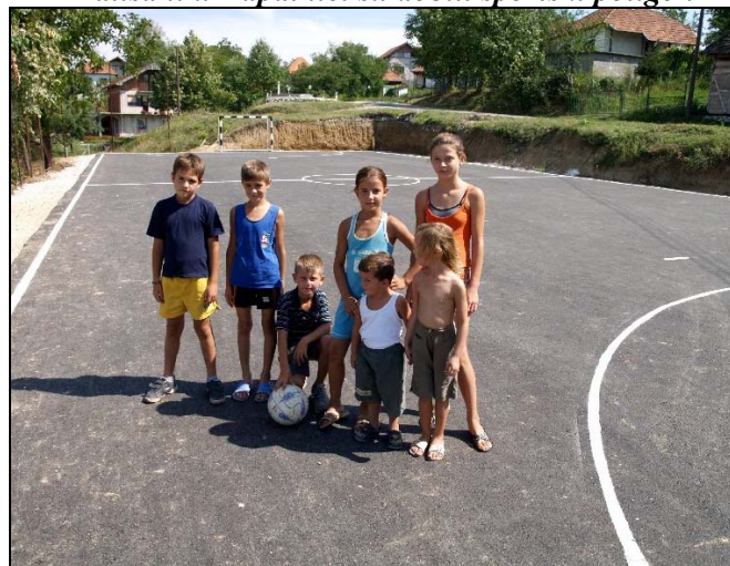
Mještani Donjih Moranjaka su dobili sportski poligon

Mještani Ibrića konačno su riješili pitanje vodosnadbijevanja, a ovaj projekat vrijedan je 120.000 KM. Javna rasvjeta stigla je u ulice Rukiba Sinanovića, Džemala Bijedića, Safvet-bega Bašagića, pored stambeno-poslovne zgrade «Papagajka», između «Mješovite srednje škole» i «Prve osnovne škole», kao i u Donjim Hrgovima, a vrijednost ovog projekta je 47.000 KM. Veliko klizište sanirano je u Gornjim Moranjcima na Regionalnom putu Orahovica-Srebrenik u šta je investirano 185.000 KM, dok je u Donjim Moranjcima izgrađen sportski poligon vrijedan 18.600 KM. Naselje Rapatnica dobilo je također sportski poligon vrijedan 5.000 KM, dok je kod OŠ u Kugama izgrađen sportski poligon vrijednosti 23.000KM, a u toku je izgradnja sportskog poligona u Čehajama vrijednosti oko 30.000 KM.