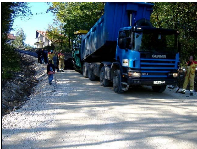
Asfaltiran je putni pravac Uroža-Kiseljak

Prigradsko naselje Polje spojeno je asfaltnim putem sa Magistralnom cestom Tuzla-Orašje u dužini od 640 metara, u šta je investirano 63.000 KM. Više od 62.000 KM utrošeno je u 850 metara novog asfaltnog sloja u Gornjim Čekanićima, dok je naselje Behrami dobilo novu savremenu rasvjetu u dužini od 700 metara kroz ovo naselje sve do Šahmera, a ukupna vrijednost ovog projekta je 17.500 KM. S obzirom da je od Centra Srebrenika udaljena desetak kilometara, mještanima Sladna je priskrbljena apoteka, kako bi im lijekovi bili na dohvat ruke, a Općina Srebrenik je ovdje uložila 20.000 KM. Naselje Uroža spojeno je novim slojem asfalta sa Kiseljakom, a u rekonstrukciju 300 metara ovoga puta investirano je 34.000 KM, dok je u 400 metara puta u Centru Špionice uloženo 40.000 KM.