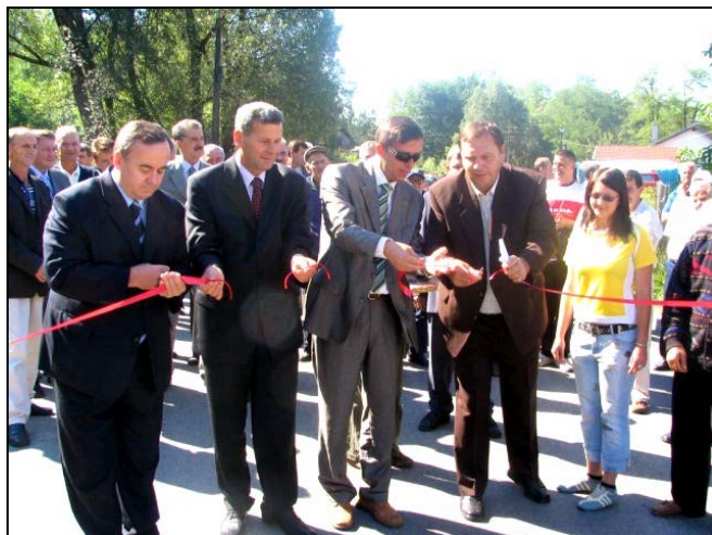
Otvoren je Regionalni put Preville-Čelić