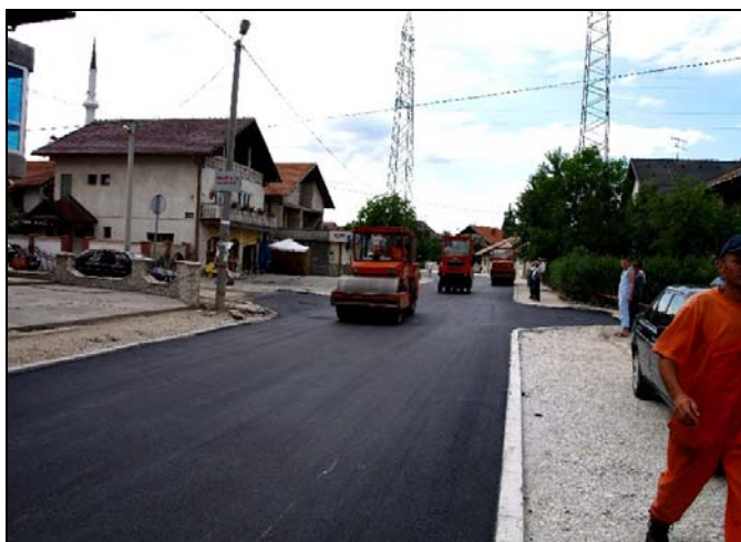
Rekonstruisan je Reg. put kroz Bare