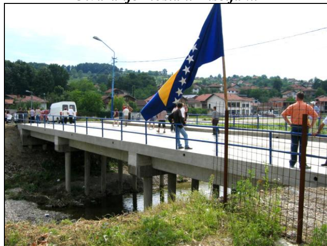
Sa ceremonije otvaranja novog mosta u Kiseljaku