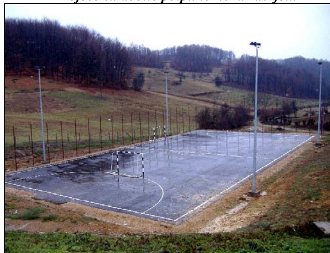
Falešići su dobili sportski poligon sa rasvjetom

Kako bi se mališanima u N.N. Kiseljak obezbijedili sadržaj za igru i zabavu, u ovom prigradskom naselju otvoren je Zabavni park u šta je investirano više od 7.000 KM. U junu 2007.godine investirano je 250.000 KM za kanalizaciju u Babunovićima i Čojlučkom polju, čime je riješen jedan veliki infrastrukturni projekat. Novu rasvjeta stigla je i u Duboki Potok, a vrijednost ovog projekta je 200.000 KM. Nakon što je prigradsko naselje Sječe dobilo novi asfalt, uslijedio je i projekat uređenja javne rasvjete koji je iznosio 8.300 KM. Falešići su također dobili prostor za sport i rekreaciju, a za poligon sa rasvjetom utrošeno je 41.000 KM. Kako bi se zaustavilo urušavanje Starog grada u Gornjem Srebreniku, izvršena je konzervacija «Gradine» a vrijednost ovih radova iznose 98.000 KM.