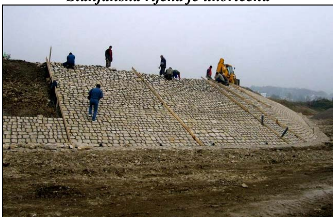
...a i rijeka Tinja