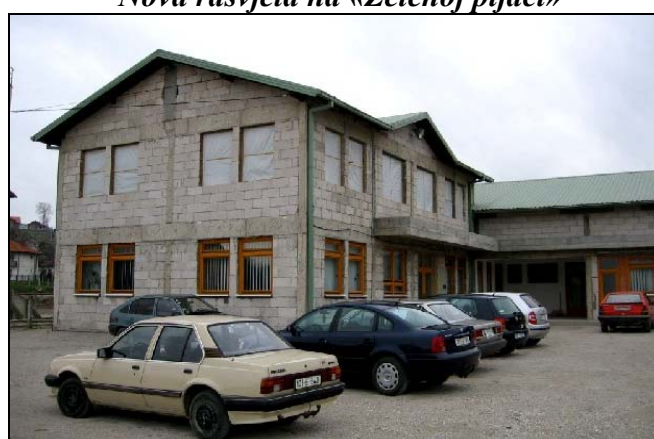
Nova upravna zgrada JKP» 9.septembar»