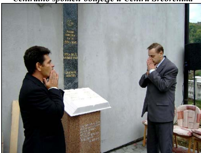
Spomen-obilježje u Huremima