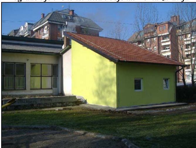
U dogradnju Obdaništa uloženo 33.000 KM