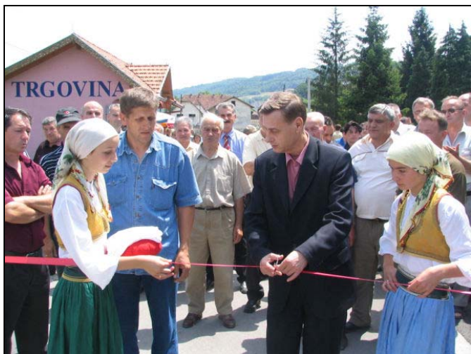
Otvaranje puta u Dubokom Potoku

U proljeće 2005.godine Gornji Čekanići su dobili 2.100 metara novog asfaltnog puta, čija je vrijednost 155.000 KM, dok je za 220 metara puta u Gornjoj Tinji u ljeto iste godine utrošeno 18.000 KM. Od sredine 2005.godine mještani N.N. Kiseljak dobili su i drugu traku na mostu kojim se dolazi u ovo prigradsko naselje, u šta je investirano blizu 70.000 KM. U Dubokom Potoku, također u ljeto 2005.godine, otvorena su dva putna pravca, za šta je utrošeno više od 70.000 KM. U puteve MZ Cage u 2005.godini investirano je više od 200.000 KM, a riječ je o 780 metara puta u Centru ove MZ, kao i dva lokalna puta u dužini od po 650 metara.