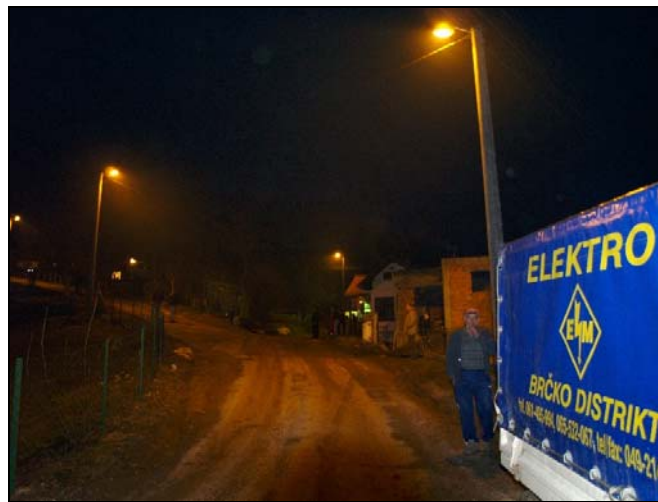
Dubokom Potoku nova rasvjeta