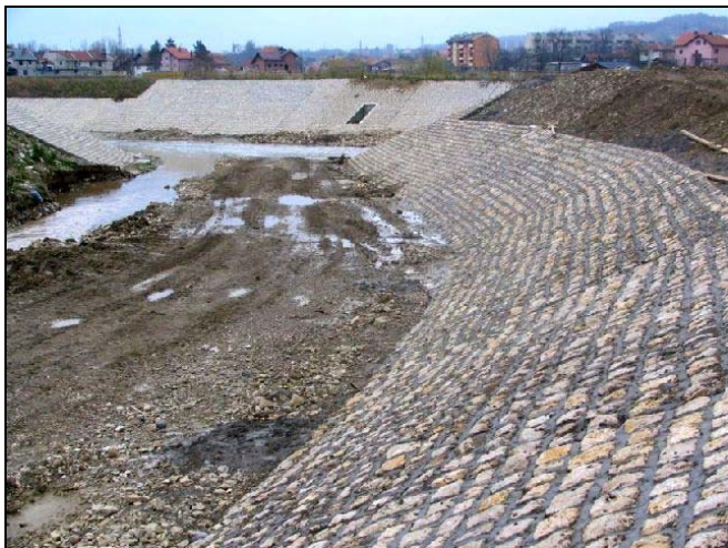
Slanjanska rijeka je ukorićena

Poplave koje su ranijih godina nanijele milionske štete, očito se više neće dešavati na području općine Srebrenik, s obzirom da se za korićenje rijeke Tinje i Slanjanske rijeke utrošilo više od 800.000 KM, a u postupku je tenderska procedura za izbor ponuđača za korićenje rijeke Tinje prema Kiseljaku u dužini oko 1km i iznosa preko 1 milion KM. Javno komunalno preduzeće «9.septembar» konačno je dobilo nove prostorije na Kiseljaku nakon što je izmješteno iz Centra Srebrenika u čiji je projekat investirano više stotina hiljada maraka. Mještani prigradskog naselja Kiseljak dobili su poligon za vanjski šah u šta je investirano 9.000 KM, dok su identičan dobili i stanovnici Dubokog Potoka, kao i građani Centra Srebrenika. Rekonstruisana je postojeća i postavljena nova rasvjeta na «Zelenoj pijaci».