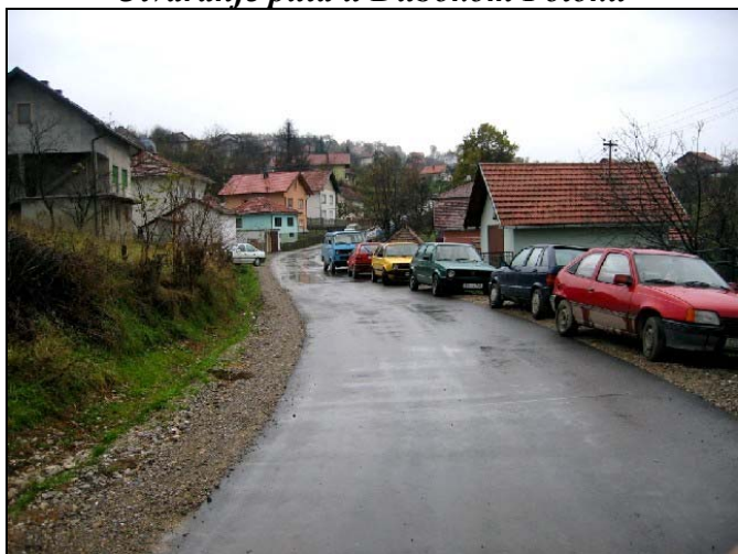
Asfaltiran je put u Čagama