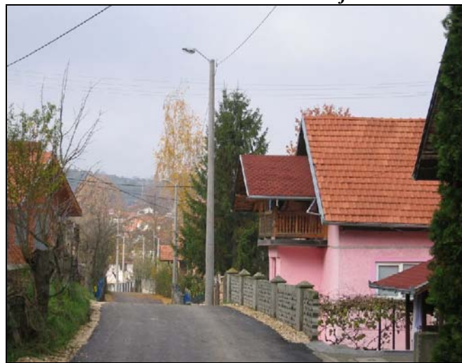
NN Sječe su dobile potpuno novu rasvjetu