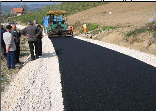
Asfaltiran je put Čehaje-Mustafići