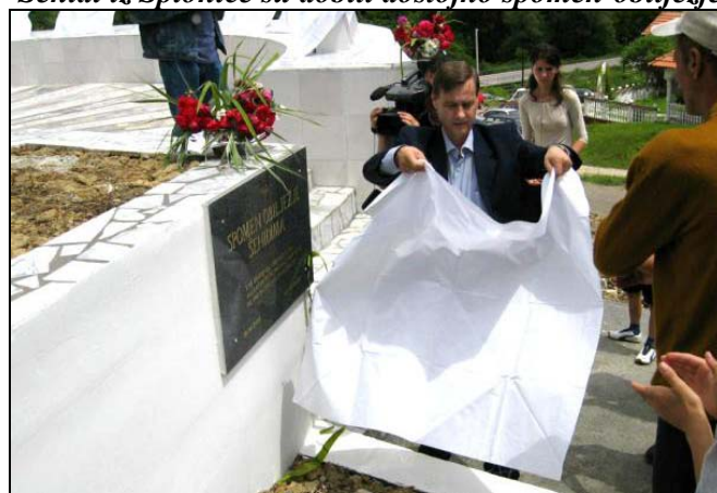
Spomen-obilježje u Behramima