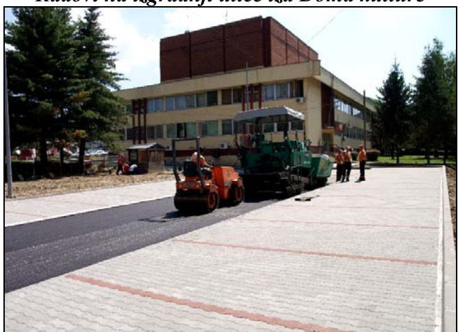
Nova ulica i parkinzi iza Doma kulture