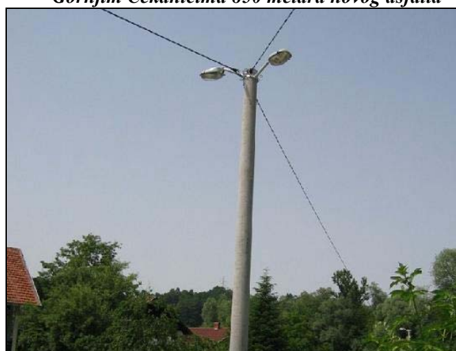
Nova rasvjeta u Behramima