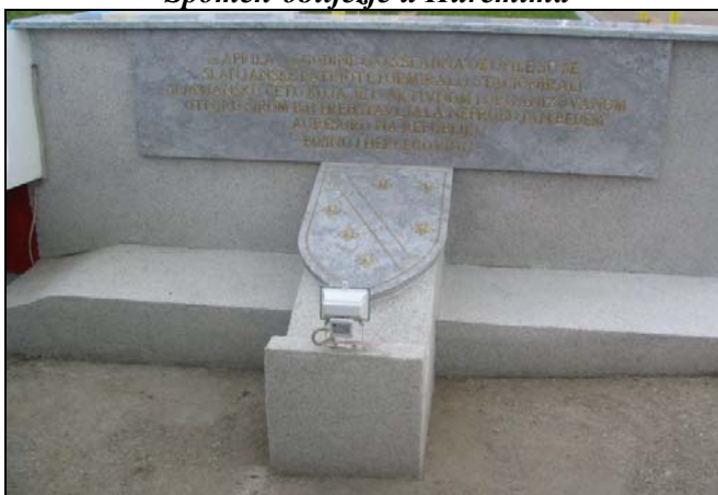
Spomen-ploča Slanjanskoj četi