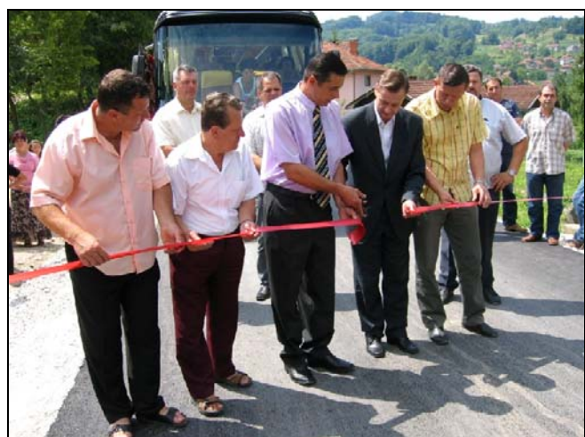
Otvorenje novog asfaltnog puta kroz Ljenobud