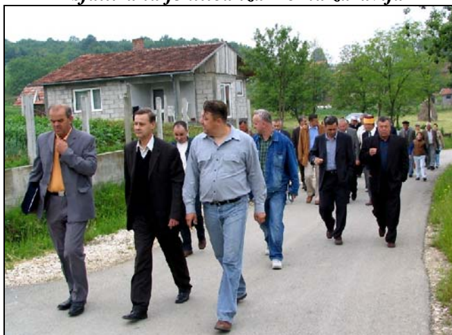
Obilazak trase novog puta u Babunovićima

Dva velika projekta urađena su u Centru Srebrenika, i to ulica i parking prostori iza «Doma zdravlja» kao i pored «Centra za kulturu i informisanje» sa savremenom rasvjetom u šta je investirano 280.000 KM. U MZ Babunovići investirano je 220.000 KM u putne pravce i to u mjesnom uredu Ferizovići, zatim Avdići-Gajevi te Okreta-Kanatić u ukupnoj dužini od 2.500 metara. Da Bare više neće biti bare, dokaz je infrastrukturni projekat kroz ovo naselje u dužini od 1.000 metara gdje su izgrađeni novi odvodi sa trotoarima, sa modernom cestom u šta je investirano 800.000 KM. Kada se uzme u obzir da je ovo naselje sada zaštićeno i od poplava, može s pravom kazati da su Bare postale moderno prigradsko naselje.