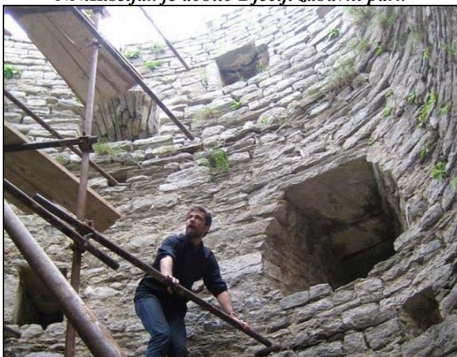
Okončana je konzervacija Starog grada «Gradine»