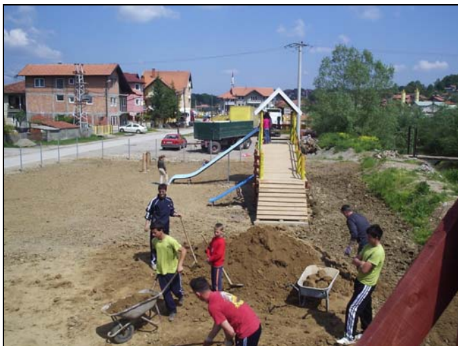
NN.Kiseljak je dobilo Dječiji zabavni park