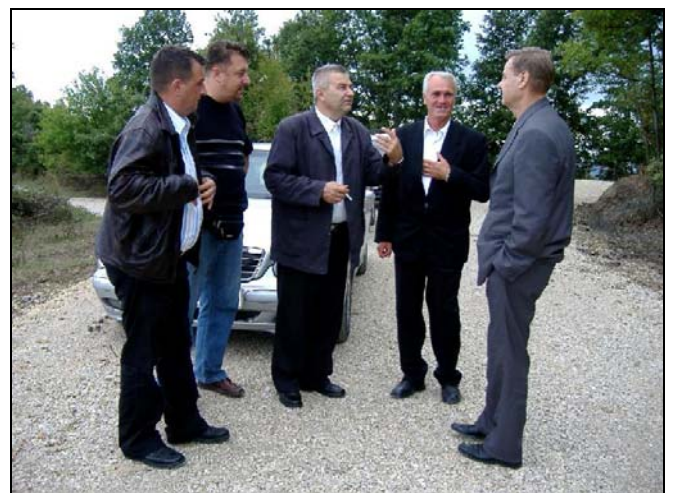
U Crvenom Brdu 1.300 metara novog puta