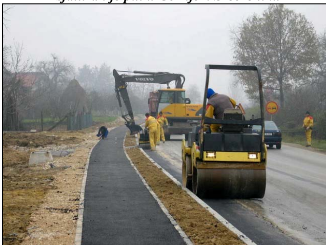
Trotoari na Magistralnom putu kroz Čehaje