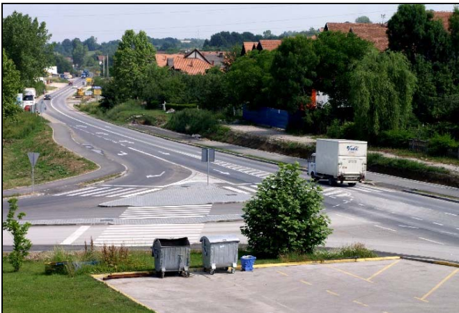
Asfaltirana je raskrsnica Reg. i Mag. puta

U jedan od najznačajnijih projekata u Centru Srebrenika investirano je 240.000 KM a u pitanju je rekonstrukcija dionice Reg. puta u dužini od 500 metara od motela «Park» do Policijske stanice, dok je u raskrnicu kod «OS-Petrola» investirano 220.000 KM, čime se dobio još jedan izlaz na Magistralni put. Prigradsko naselje Sječe dobili su 450 metara novog asfaltnog puta u šta je investirano 34.000 KM. Rekonstruisan je put kroz Ljenobud do Dubokog Potoka gdje je za 1.500 metara asfaltnog puta utrošeno 150.000 KM. Mještani Crvenog Brda dobili su novu putnu komunikaciju dužine 1.300 metara u šta je utrošeno 54.000 KM, dok je za spajanje asfaltnim putem Mustafića sa Čehajama u dužini od 1.000 metara, utrošeno 65.000 KM, a uskoro slijedi asfaltiranje i preostalih 1.500 metara.