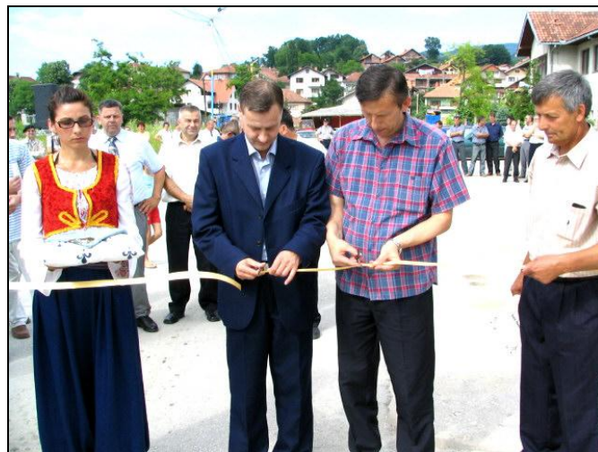
Otvaranje mosta u Kiseljaku