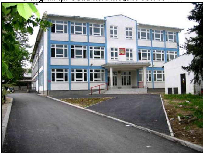
Dograđen je i rekonstruisan objekat MŠS Srebrenik