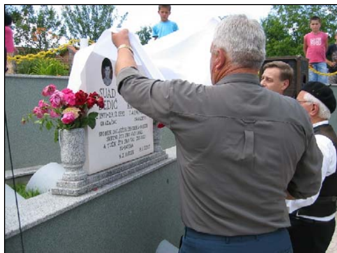
Spomen-obilježje u Breziku