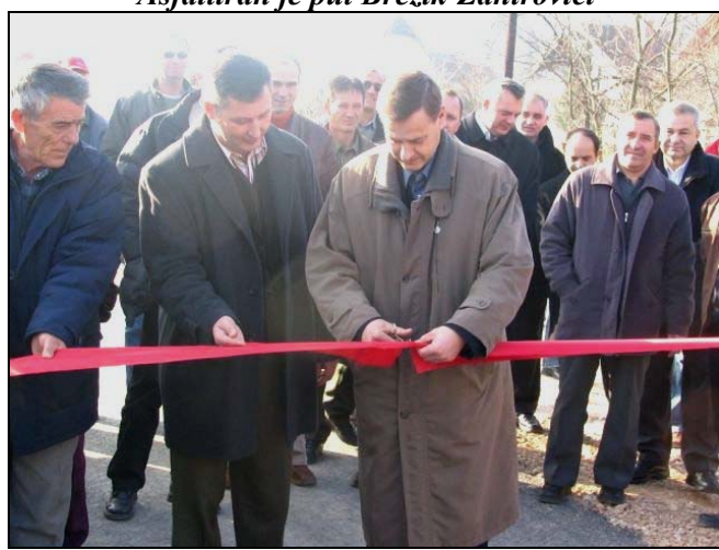
Otvaranje puta u Uroži

Mještani Urože dobili su konačno prve kilometre asfaltnog puta krajem 2006.godine, a u ovih 1.640 metara investirano je 143.000 KM. Regionalni put Preville-Čelić ugledao je svjetlo dana i to u dužini od 860 metara a vrijednost ove investicije je 200.000 KM. Dionica Brezik-Zahirovići u dužini od 950 metara vrijedna je 100.000 KM. U Lisovićima je postavljen novi asfaltni sloj u dužini od 2.500 metara vrijedan 170.000 KM, a za put kroz Drapniće dužine 670 metara uloženo je 237.000 KM. Također, rekonstruisana je i Radnička ulica u Centru Srebrenika, a u njoj su izgrađeni i novi parking-prostori. Tokom 2006.godine asfaltiran je i put Dedići-Seona u dužini od oko 2000m u šta su građani i Općina uložili oko 157.000 KM.