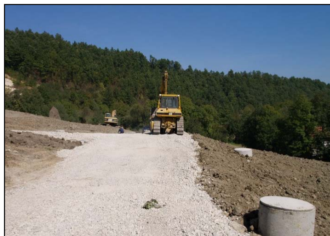
U G. Moranjcima je sanirano veliko klizište