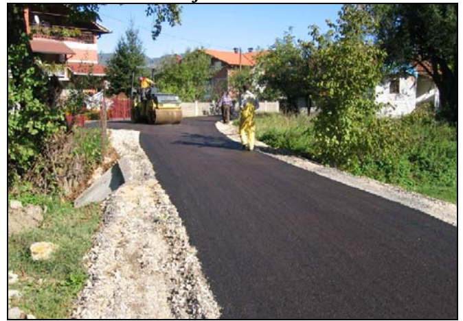
Naselje Sječe je dobilo novi asfalt