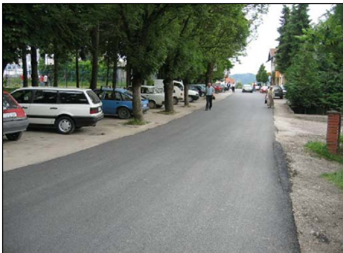
Rekonstruisana je Radnička ulica u Srebreniku