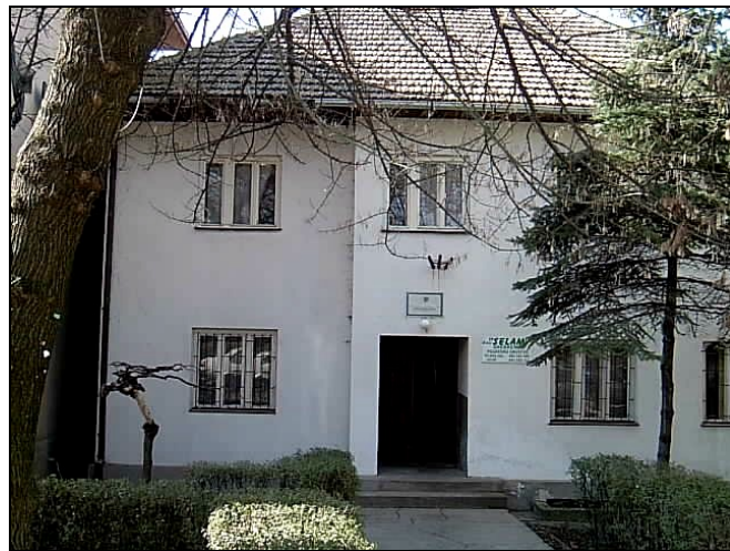
Bivša zgrada Medžlisa IZ Srebrenik