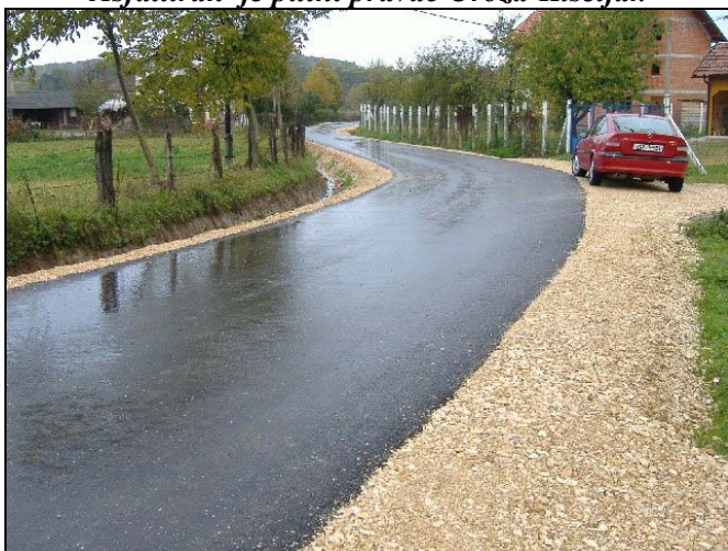
Centar Špionice je dobio novi asfaltirani put