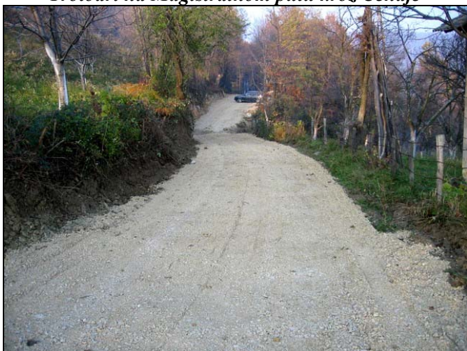
Probijen je put za groblje u Straži