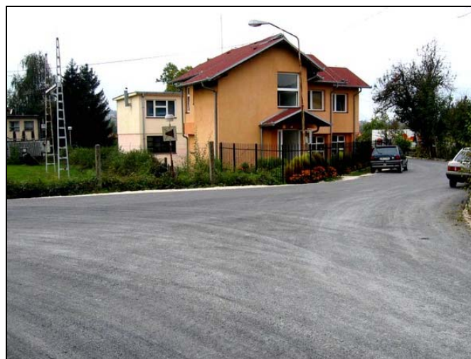
Asfaltirana je ulica Vahida Ibrića u Srebreniku