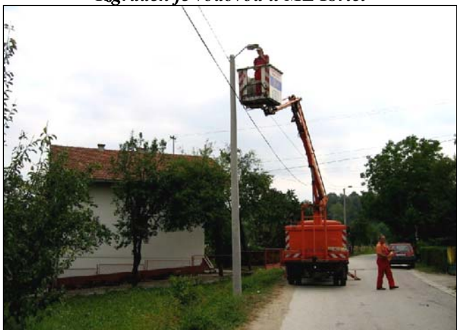
Nova javna rasvjeta u ulici Rukiba Sinanovića