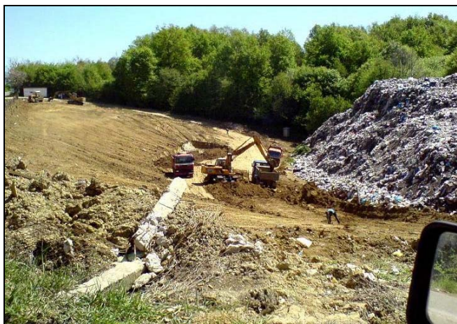
Početak radova na sanaciji deponije