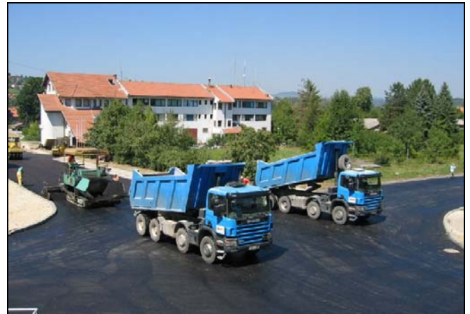
Rekonstruisana je raskrsnica kod MUP-a