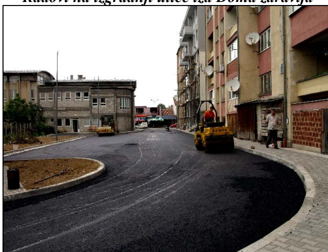
Asfaltirana je ulica iza Doma zdravlja