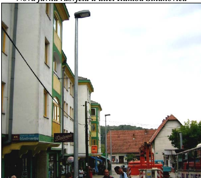
Nova rasvjeta pored «Papagajke»