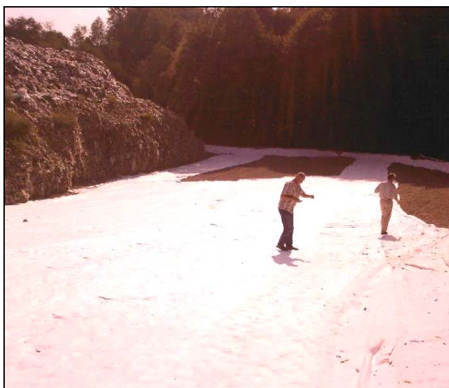
U II fazi završena je izrada podloge površine 4000 m 2 na koju će se u narednom periodu moći propisno odlagati otpad, dok će se uraditi prekrivka na dodatnih 3000m 2 gdje je završeno odlaganje otpada

Nakon što je općina Srebrenik otkupila zemljište u vrijednosti oko 160.000 KM, početkom marta 2007. g. krenula je realizacija I faze sanacije deponije otpada vrijednosti oko 892.000 KM, koju su radnici «ITK Musić» Srebrenik okončali u aprilu 2008.g. Svi radovi na pripremanju podloge, prebacivanju ranije deponovanog otpada, izgradnji sistema za prikupljanje procjednih voda, sistema za otplinjavanje te završno prekrivanje nepropusnim slojevima i zemljom, su urađeni po projektno-tehničkoj dokumentaciji, čime je ova deponija ispunila sve ekološke i sanitarne norme EU, te je, kao jedina na TK-u, nedavno dobila prolaznu ocjenu od Komisije Vlade TK-a i kantonalne inspekcije. Trenutno se izvode radovi na II fazi sanacije deponije otpada vrijednosti oko 425.000 KM, u sklopu kojih je završena izgradnja kasete površine 4000m 2 za odlaganje otpada u narednom periodu. Radovi su finansirani uglavnom iz općinskog budžeta, uz manju pomoć nadležnog kantonalnog ministarstva i Vlade FBiH.