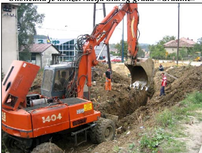
Sanacija kanalizacije u Čojlučkom polju