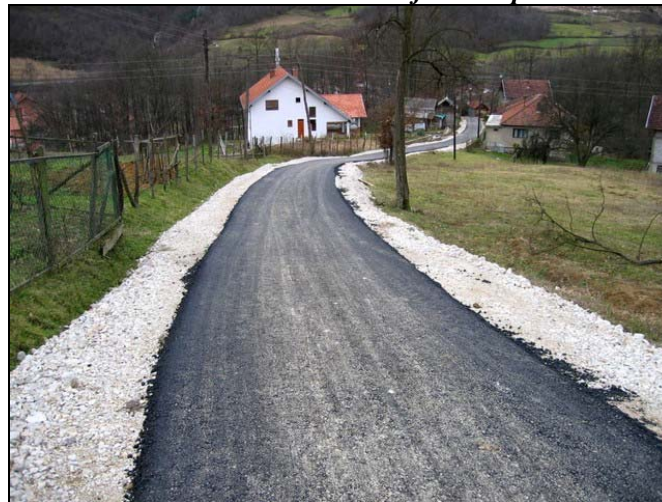
Novi asfalt za mještane Bjelava