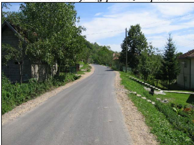
Rekonstruisan je put kroz Lisoviće