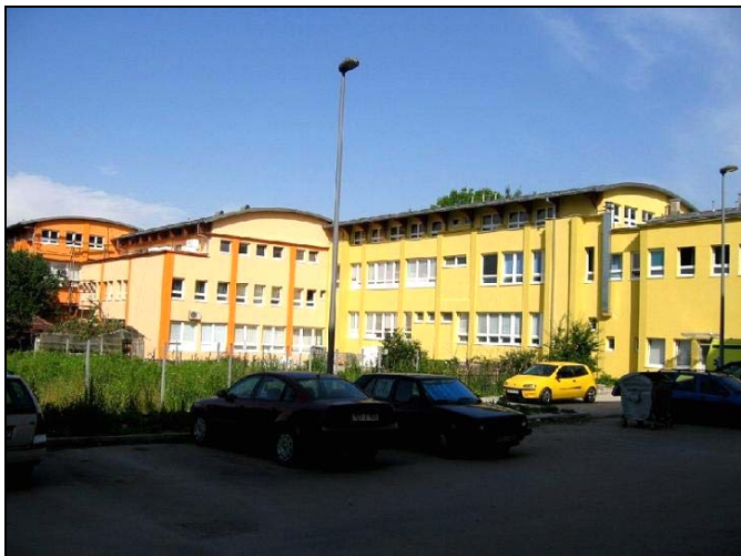
Dograđen je i rekonstruisan objekat Doma zdravlja

U cilju unapređenja zdravstvene zaštite JZU Dom zdravlja Srebrenik je dobila dodatnih 1000m 2 prostora, objekat je u potpunosti rekonstruisan, opremljene su ambulante porodične medicine u centrima MZ-a, u šta je ukupno uloženo preko 1 milion KM. U proteklom periodu je dograđen i rekonstruisana zgrada Mješovite srednje škole Srebrenik u šta je ukupno uloženo oko 600.000 KM, dok je kod Druge osnovne škole pri kraju izgradnja sportske dvorane u šta je do sada uloženo oko 900.000 KM. Dogradnjom zgrade Obdaništa u Srebreniku u šta je uloženo 33.000 KM, isto je dobilo 72 m 2 korisne površine, čime je obezbijeđeno podizanje kvaliteta usluga na viši nivo. Na mjestu stare zgrade Medžlisa IZ Srebrenik, koja je bila jedna od najstarijih zgrada u Srebreniku, izgrađen je moderan objekat Medžlisa IZ Srebrenik.