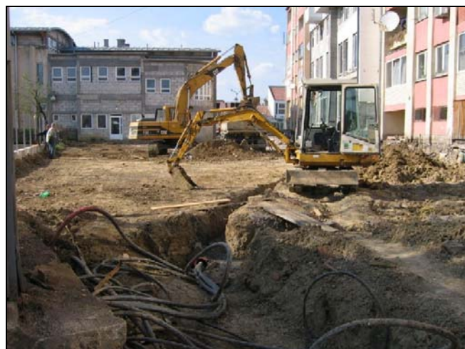
Radovi na izgradnji ulice iza Doma zdravlja