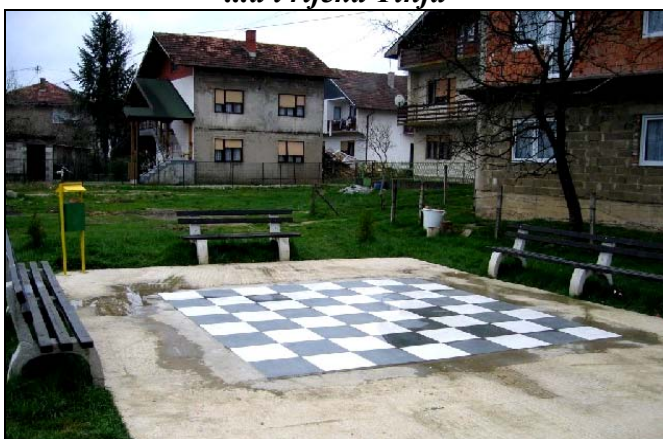
Poligon za vanjski šah na Kiseljaku