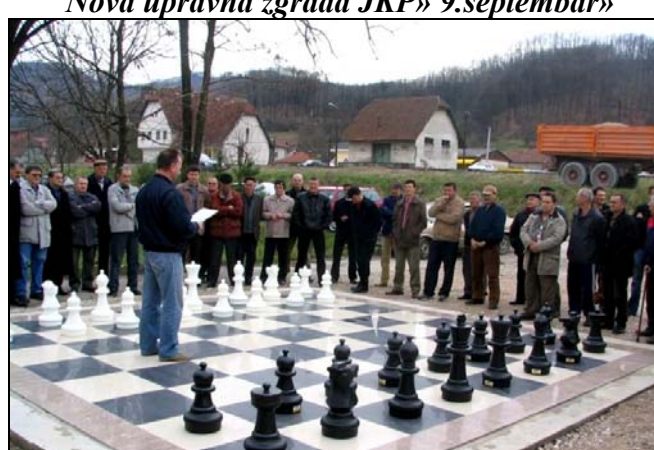
I Duboki Potok je dobio poligon za vanjski šah