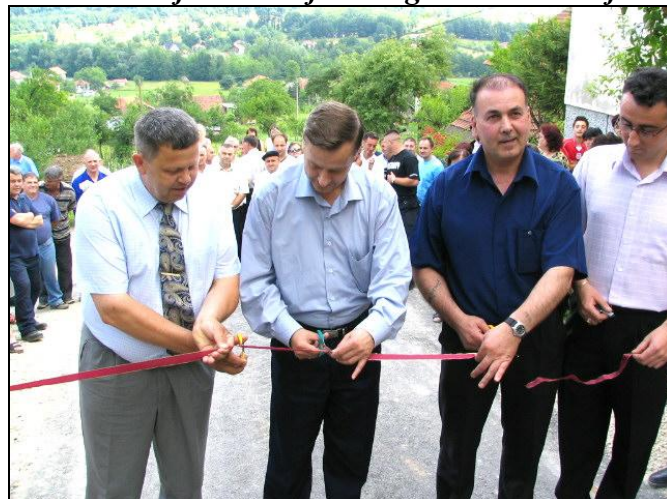
Otvaranje puta u Gornjoj Tinji