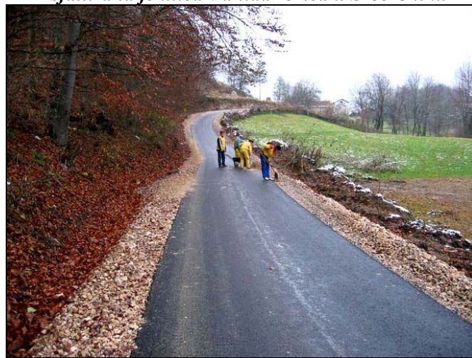
Salihbašići su dobili asfaltiran put