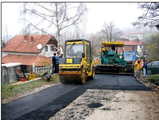
Asfaltiran je put u Gornjem Srebreniku

Salihbašići su dobili 2.500 metara novog asfaltnog puta u šta je investirano 215.000 KM. Kroz naselje Bjelave položeno je 290 metara asfaltnog puta u šta je investirano 21.000 KM, dok je u asfaltiranje jednog kraka u Falešićima uloženo 20.000 KM. Prilaz poslovnici Elektro-distribucije također je asfaltiran u dužini 200 metara a investicija je vrijedna 30.000 KM. Za asfaltiranje puta u Gornjem Srebreniku dužine 300 metara uloženo je 130.000 KM, a ovim projektom su sanirana i velika klizišta. Mještani naselja Straža, dobili su 400 metara novog puta kako bi imali bolji pristup mjesnom groblju, a izradeni su i trotoari kroz prigradsko naselje Čehaje pored Magistralnog puta.