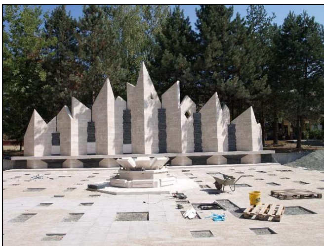
Centralno spomen-obilježje u Centru Srebrenika

Da nisu zaboravljeni oni koji su položili svoje živote za odbranu ove zemlje, svjedoče i spomen-obilježja, koja su izgrađena u zadnje četiri godine. Kako bi borci i šehidi koji su dali svoje živote za odbranu Bosne i Hercegovine dobili pravo mjesto i spomen-obilježje, pobrinula se izvršna i zakonodavna vlast koja je u sklopu novoizgrađenog Trga u ulici Alije Izetbegovića izgradila Centralno spomen-obilježje, dok su izgrađena i ona po mjesnim zajednicama. Za ono koje će podsjećati na «Slanjansku četu» gdje je svoje živote dalo 23 borca A RBiH, zatim za šehide i borce u naselju Brezik, pa u Donjoj Špionici, Huremima te u Behramima, a otkriveno je i spomen-obilježje Veljku Lukiću-Kurjaku, borcu NOR-a, koje je otvoreno u naselju Tinja.