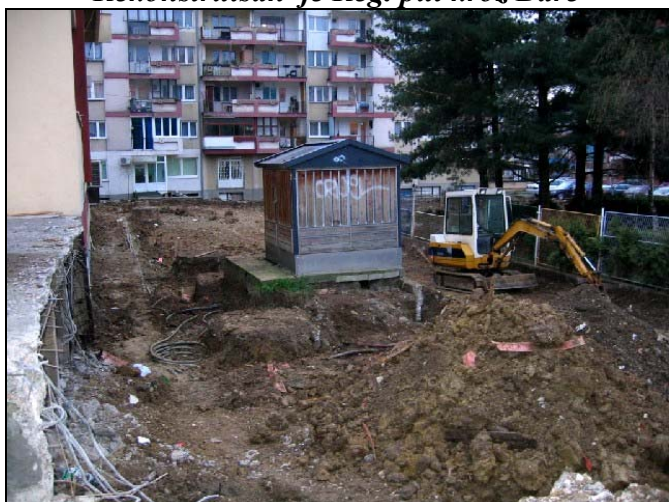
Radovi na izgradnji ulice iza Doma kulture