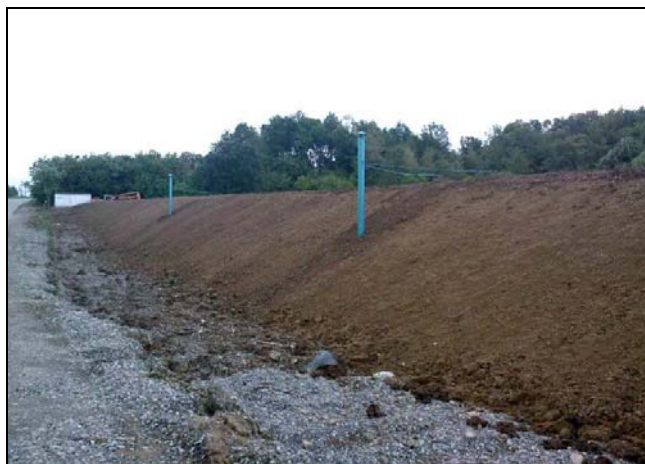
Završena je prva faza sanacije deponije