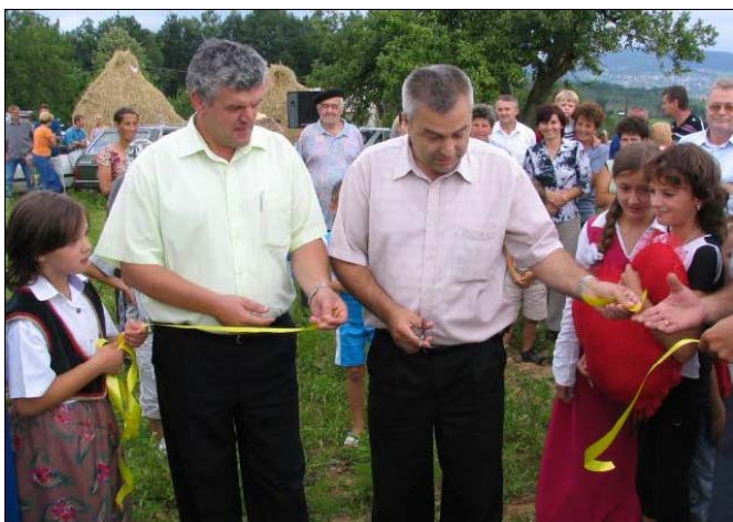
Izgrađen je vodovod u MZ Ibrići