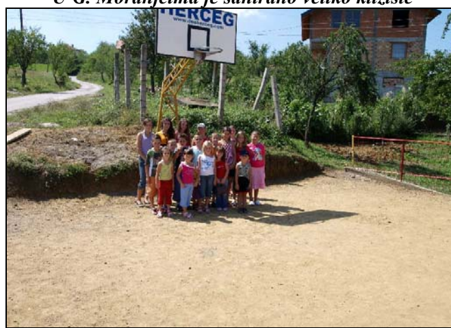
Mališani u Rapatnici su dobili sportski poligon