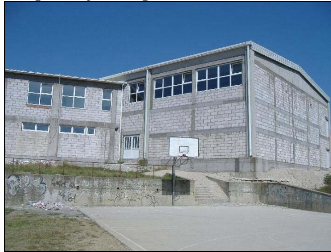
Nova sportska dvorana kod Druge osnovne škole