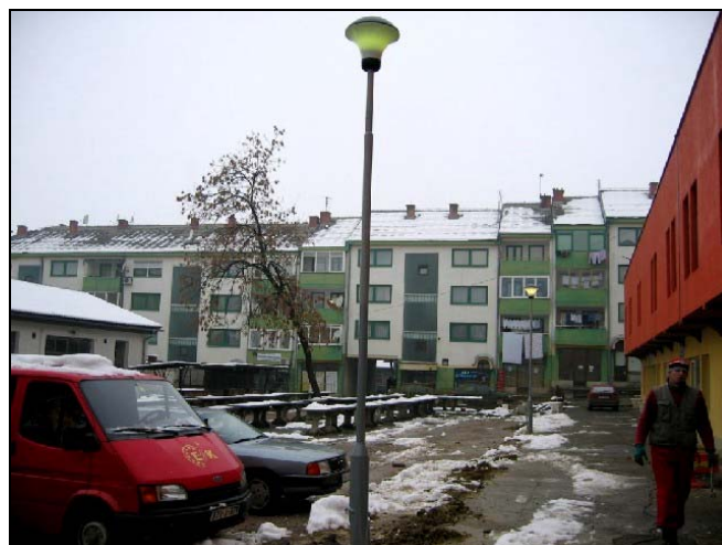
Nova rasvjeta na «Zelenoj pijaci»