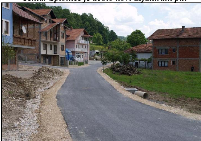
N.N. Polje je asfaltom spojeno sa Mag. putem