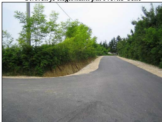
Asfaltiran je put Brezik-Zahirovići