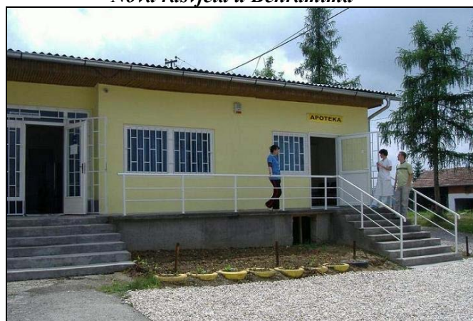
Sladna dobila apoteku