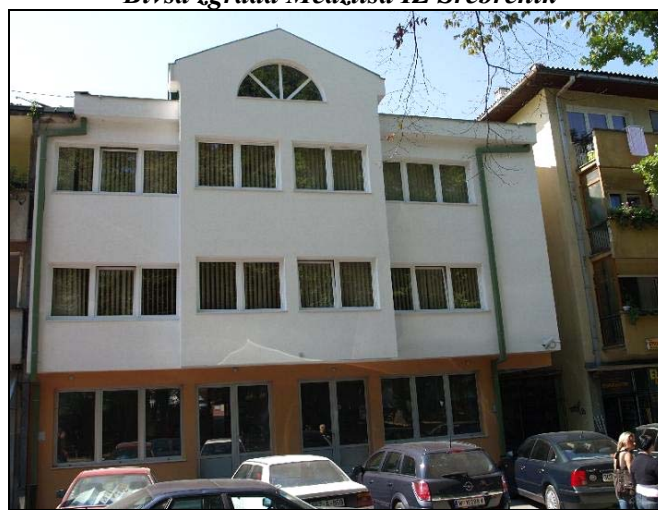
Izgrađena je nova zgrada Medžlisa IZ Srebrenik