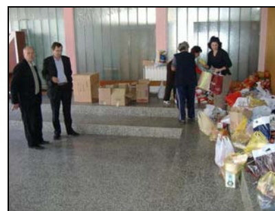
Dobar odziv učenika

Nedavno je u Srebreniku završena akcija prikupljanja hrane pod nazivom «Učenci i studenti pomažu narodnu kuhinju Imaret u Tuzli» koju je organizovalo Muslimansko dobrotvorno društvo «Merhamet RO Tuzla». Ova akcija trajala je od sredine Ramazana a uspješno je okončana i na području općine Srebrenik, kroz realizaciju u svim osnovnim i Mješovitoj srednjoj školi Srebrenik. –Ovom akcijom želimo razviti osjećaj kod djece za humanost, da treba pomagati one koji nemaju dovoljno hrane,