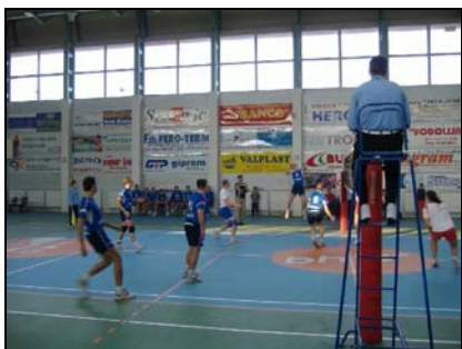
«Plavi» su jesenji prvaci