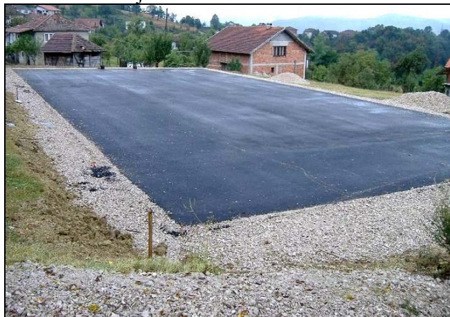
Poligon u Kugama

U Čehajama je u dvorištu područne škole nedavno završena izgradnja sportskog poligona dimenzija 30x15m, koji je nakon pripreme terena, iskopa, temeljenja, betoniranja i izrade odvoda za odvodnju površinske vode i drugih grubih građevinskih radova, asfaltiran a ovih dana se vrši kompletno zatvaranje poligona sa svih strana metalnom ogradom visine 4 metra i plastificiranom žicom, kako se ne bi oštetila fasada i prozori obližnje područne škole i spomen-obilježje u Čehajama. Za navedeni poligon Općina Srebrenik je iz budžeta izdvojila oko 30.000 KM. Od izvođača radova smo saznali da će se ovaj poligon moći i zaključati, te na taj način spriječiti nelegalno korištenje, kao i osvijetliti sa obližnje škole za korištenje noću i organizovanje noćnih turnira u malom nogometu. Ista firma također je nedavno završila istovjetan sportski poligon, kod područne škole u Kugama, za šta je Općina Srebrenik iz budžeta izdvojila 23.000 KM.