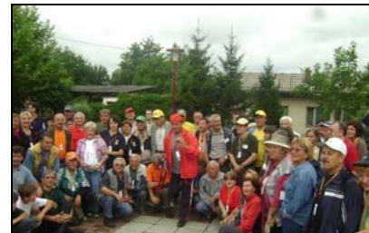
Planinari su veoma aktivni

godinu, a za ovaj period uradili su dosta toga. Kako je kazao predsjednik Skupštine Svjetlan Bešić, osnovni cilj planinara je da se približe građanima, zatim druženje na čistom zraku, kao i da se dodatno uredi planinarski dom «Lipici» koji je nedavno i rekonstruisan.