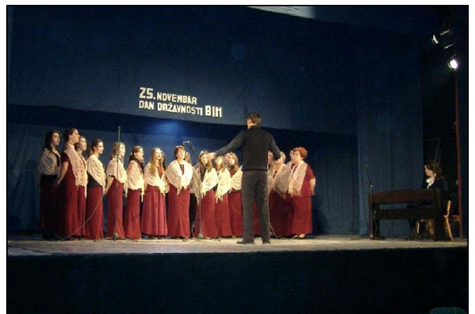
Gostima se predstavio i hor «Preporoda»

Bosna i Hercegovina ove godine slavi 65. rođendan. Naime, 25. novembra 1943. godine u Mrkonjić Gradu je održano Prvo zasjedanje ZAVNOBiH-a, gdje su se sastali po prvi puta u historiji predstavnici srpskog, hrvatskog i muslimanskog naroda, te su kazali da «BiH nije ni srpska, ni hrvatska ni muslimanska, nego da je BiH i srpska i hrvatska i muslimanska». Nakon Dejtona, obzirom da nije usvojen Zakon o praznicima na nivou države BiH, ovaj praznik se slavi samo u Federaciji BiH, dok je u RS radni dan