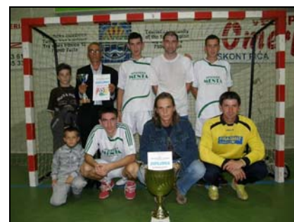
«Čehaje SDA» najbolji