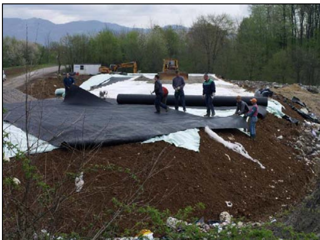
Deponija je urađena po EU normama