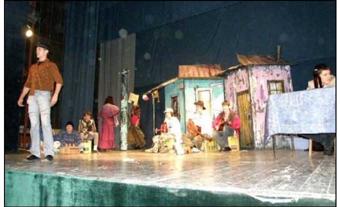
Sa predstave «Garavi sokak»

motivima poezije Mike Antića, nakon čega su, svi zajedno, učestvovali u radionici pod nazivom «Naše viđenje tolerancije». Cilj ovog projekta je, kako je navedeno na radionici, unapređivanje tolerancije i poštovanja različitosti u školskoj zajednici i društvu uopće, te uspostavljanje veza između učenika ove dvije škole. Druženje u Srebreniku je završeno zajedničkom posjetom Starom gradu u Gornjem Srebreniku, dok bi uzvratna posjeta trebala biti organizirana sredinom decembra ove godine.