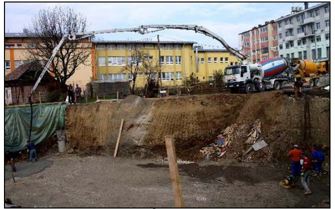
Započela izgradnja «Čehajke» kod Doma zdravlja

Nakon pripremnih radova odnosno izmještanja stubova NN mreže, krajem oktobra su zvanično započeli radovi na izgradnji stambeno-poslovnog objekta «Čehajka» u ulici 1.marta u Centru Srebrenika. Kako smo saznali od jednog od investitora Nezira Ibrića iz Srebrenika, radi se o savremenom objektu koji će imati suteran, prizemlje i dva sprata i čija se ukupna vrijednost procjenjuje na oko 2 miliona KM. Trenutno se nakon zemljanih radova-iskopa na polovici objekta,