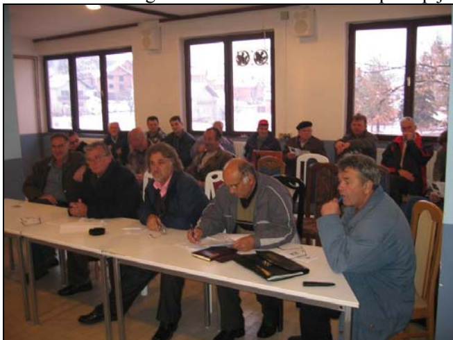
Sa Javne rasprave u Tinji

Nedavno su održane javne rasprave po pitanju budžeta Općine Srebrenik za 2009.g., infrastrukture, kapitalnih investicija i uređenja gradskog građevinskog zemljišta, u svim mjesnim područjima općine Srebrenik, gdje su građani predstavnicima izvršne vlasti Općine Srebrenik iznijeli svoje zahtjeve, sugestije, mišljenja..., šta bi to oni željeli da se u narednoj godini riješi po pitanju infrastrukturnih i drugih projekata. U mjesnom području Podorašje, mještani Drapnića su insistirali na rješavanju problema ulične rasvjete u Drapnićima, za koju imaju elektro-projekat, urbanističku i građevinsku dozvolu te prikupljen