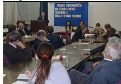
Svjetski dan hrane