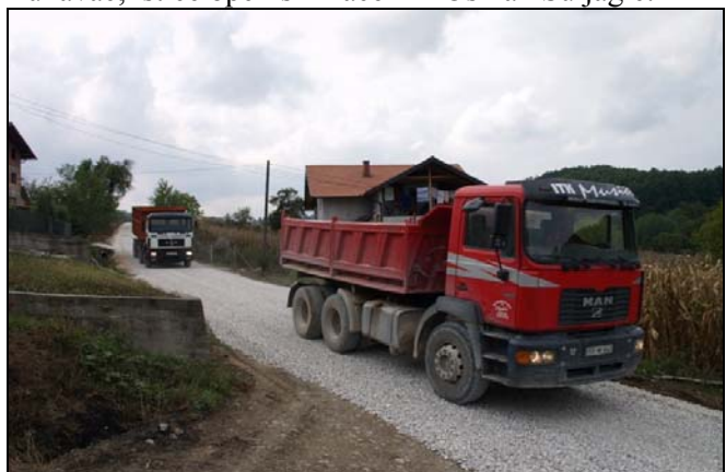
Bolja komunikacija sa Gračanicom i Lukavcem