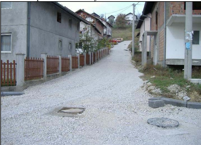
U Naselje Neum bit će investirano 2,5 miliona KM

Naselje Neum u Srebreniku, koje se nalazi u blizini Druge osnovne škole, nedavno je pretvoreno u pravo gradilište. Naime, radnici firme «ITK Musić» d.o.o. Srebrenik, već nekoliko sedmica intenzivno rade na izgradnji odvodnih kanalizacionih krakova, zatim pripremanju podloge za polaganje asfalta kao i postavljanju ivičnjaka za uređenje trotoara. Riječ je o glavnoj ulici u ovome naselju dužine oko 1.000 metara i širine 3,5 metra kao i niz sporednih ulica koje će dobiti jednu sasvim novu dimenziju te bolji i ljepši izgled. Uz to, najveći značaj ovog projekta je taj što će se umnogome zaustaviti nestabilna padina koja je ozbiljno prijetila građanima ovoga naselja. U pitanju je projekat vrijedan blizu 2 miliona maraka, a u ovu prvu fazu iz budžeta Općine Srebrenik je investirano 255.000 KM.