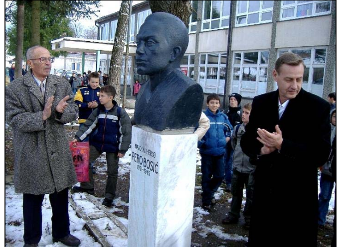
U Podorašju je otkrivena obnovljena spomen-bista Peri Bosiću

Potom je uslijedio kulturno-zabavni program gdje je ženski hor bošnjačke zajednice kulture «Preporod» izveo jednu pjesmu o Bosni i Hercegovini, a potom su članovi «Umjetničke radionice» odrecitovali i otpjevali nešto iz svog repertoara. Na kraju obilježavanja 25. novembra-Dana državnosti, otkrivena je, u dvorištu Osnovne škole u Podorašju, obnovljena spomen-bista Peri Bosiću, narodnom heroju iz Drugog svjetskog rata.