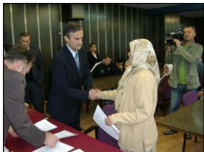
Sa potpisivanja ugovora

U Srebreniku je, krajem septembra, 46 porodica iz reda boračkih populacija (demobilisani borci, porodice šehida i RVI) potpisalo ugovore o dodjeli bespovratnih sredstava za rješavanje stambenog pitanja sa područja općine Srebrenik. U pitanju je 624.500 KM bespovratnih sredstava koje su dodijeljene korisnicima iz gore navedenih populacija i ovaj projekat egzistira od 1999.godine. – Ovim je završen jedan proces koji je općinska Služba za boračku zaštitu započela zajedno s nama iz Ministarstva za boračka pitanja u Vladi TK. Dakle ovih 624.500 KM je pomoć u stambenom zbrinjavanju ovih 46 korisnika, koji žive na području općine Srebrenik i koji su imali najveći broj bodova. Od samog početka realizacije ovoga projekta, do sada je na područje općine Srebrenik, na ime pomoći za 467 korisnika, transferisano ukupno 4.196.000 KM. Kada se ovaj iznos podijeli, dobije se podatak da je svaki korisnik dobio po približno 9.000 KM. Na području Tuzlanskog kantona dodjeljuje se ukupno 7.336.000 KM. I u sljedećoj godini ćemo u budžetima planirati određena sredstva za ove kategorije, kazao je Bahrija Mehurić, ministar za boračka pitanja u Vladi Tuzlanskog kantona.