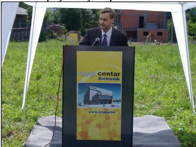
Načelnik Osman Suljagić

U protekle četiri godine Vašeg mandata općina Srebrenik je doživjela jedan veliki infrastrukturni procvat. Je li urađeno sve što ste zamislili i u kojoj mjeri ste zadovoljni, te koji su to projekti koje ste planirali uraditi?