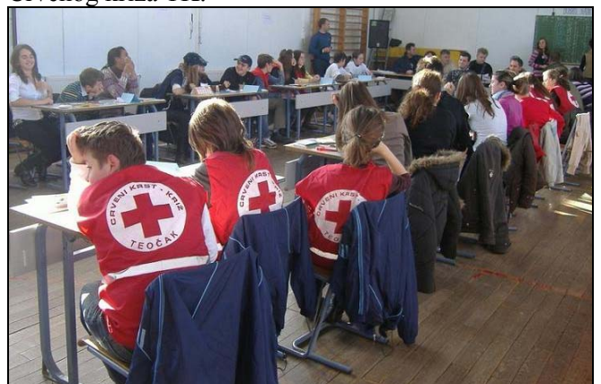
Osnovci su pokazali zavidan nivo znanja o minama