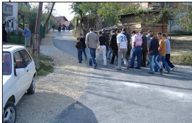
Mještani su zadovoljno prošetalii novim putem