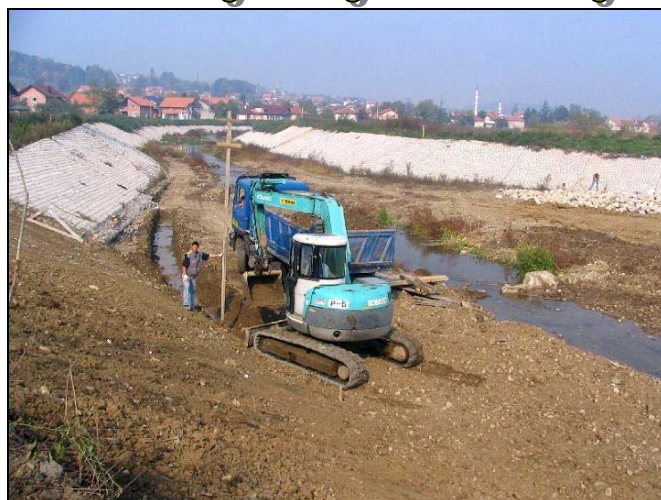
Novih milion maraka za korićenje rijeke Tinje

Za korićenje rijeke Tinje i Slanjsanske rijeke do sada je utrošeno više od 800.000 KM. Nakon što je urađen i revidovan projekat nastavka korićenja rijeke Tinje od ušća Slanjsanske rijeke u rijeku Tinju prema mostu u naselju Kiseljak, u ukupnoj dužini od preko 1km, apliciralo se kod agencije «Vodno područje Slivovi rijeke Save» Sarajevo za potrebna sredstva. U veoma jakoj konkurenciji smo uspjeli dobiti novih 1,28 miliona KM za navedene radove i nakon okončanja tenderske procedure za izbor najpovoljnijeg izvođača radova je izabrana firma «Reweus» d.o.o. Lukavac, koja uveliko izvodi radove. Kako saznajemo od Ibrahi-