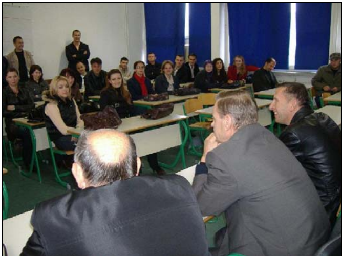
Pripravnici nisu krili oduševljenje

Početak oktobra 30 pripravnika sa područja općine Srebrenik potpisalo je ugovore o početku odrađivanja pripravničkog staža u osnovnim i Mješovitoj srednjoj školi Srebrenik. Tako će svršeni visokoobrazovani mladi ljudi sa ovog općinskog područja biti u prilici da sa završetkom ove školske godine dobiju priliku za polaganje Stručnog ispita a nakon toga da ravnopravno konkurišu za određeno radno mjesto u bilo kojoj školi u BiH. – U saradnji sa Ministar-