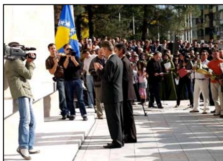
Premijer Mujić i ministar Mehurić odaju počast šehidima

Brojnim prisutnim gostima prigodnim govorima u povodu otvaranja Centralnog spomen-obilježja obratili su se i premijer Vlade TK, Enes Mujić, ministar za boračka pitanja u Vladi TK, Bahrija Mehurić te Zajkan Mrkaljević, predsjednik Udruženja porodica poginulih boraca. Svečanom otvaranju Centralnog spomen-obilježja prisustvovalo je blizu 5.000 ljudi, a opća je ocjena kako je ovo spomen-obilježje postavljeno na