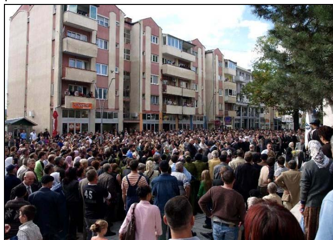
Svečanom otvaranju prisustvovalo je oko 5.000 ljudi