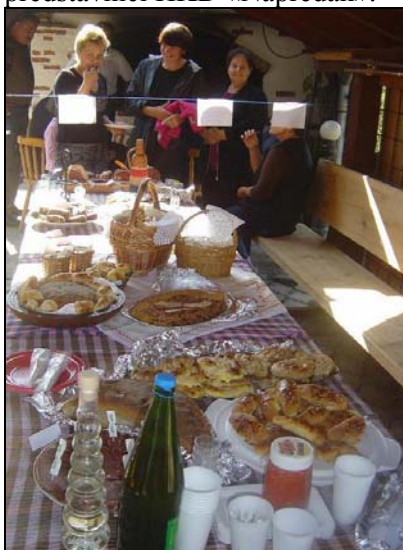
Bogata trpeza na manifestaciji