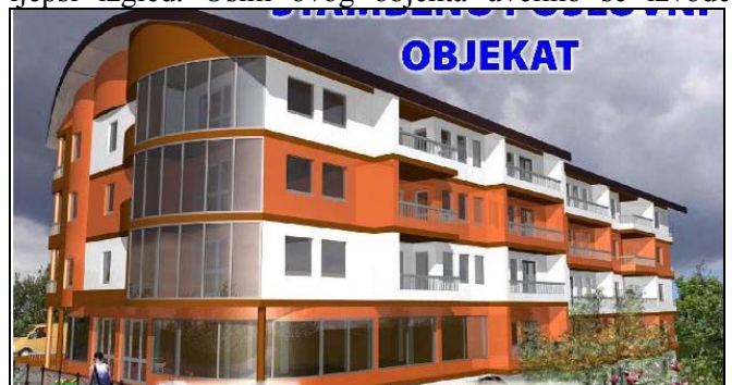
Izgled budućeg SPO-a kod zgrade Druge OŠ

vrši betoniranje investitora Ibrića, a uskoro bi se trebali isti radovi nastaviti i na preostaloj polovici objekta. Izgradnjom stambeno-poslovnog objekta «Čehajka» ovaj dio Centra Srebrenika dobit će sasvim drugačiji i ljepši izgled. Osim ovog objekta uveliko se izvode