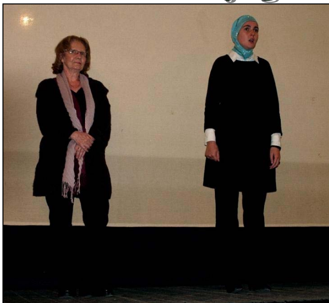
Sa premijere filma «Snijeg»

Centar za kulturu i informisanje, publici u Srebreniku je premijerno predstavio film «Snijeg» Aide Begić. Film prati priču šest žena, jednog starca, četiri djevojčice i jednog dječaka koji žive u ratom razorenom i izoliranom selu Slavno. Jedina nada u opstanak i ostanak mještana je proizvodnja i prodaja ekološki zdrave hrane, a nakon što dva poslovna čovjeka posjete selo i zatraže od seljana da ga napuste uz novčanu naknadu, među mještanima dolazi do podjele. Oni su pred dilemom - prihvatiti ponudu i spasiti živote, ali ujedno razoriti vlastite duše. Iako se radi o sumornoj životnoj drami film odiše optimizmom uz poruku da je bolje sutra, uz velika odricanja i upornost, ipak moguće. Dugometražni prvijenac Aide Begić ovogodišnji je bosanskohercegovački kandidat za najprestižniju filmsku nagradu - Oscar. Film je svjetsku premijeru imao na Cannes Film Festivalu, gdje je osvojio Grand Prix programa «Sedmica kritike». Nakon 14. Sarajevo Film Festivala, "Snijeg" je prikazan na brojnim svjetskim filmskim festivalima. Nakon prikazivanja filma, oko 350 gledalaca je aplauzom pozdravilo rediteljku Aidu Begić i glumicu Vesnu Mašić. –Film nisam pravila za filmske festivale, iako je isti obišao brojne svjetske filmske festivale i osvojio značajne nagrade, nego za naše gledaoce i veoma mi je drago da ste razumjeli poruku filma te da je naišao na ovako dobar prijem-istakla je Aida Begić u kratkom obraćanju srebreničkoj publici.