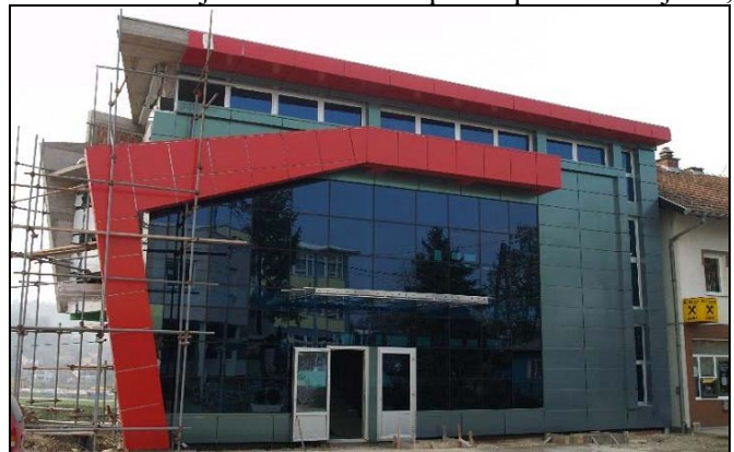
Poslovni objekat kod MSŠ Srebrenik

Nakon pripremnih radova odnosno izmještanja stubova NN mreže, krajem oktobra su zvanično započeli radovi na izgradnji stambeno-poslovnog objekta «Čehajka» u ulici 1.marta u Centru Srebrenika. Kako smo saznali od jednog od investitora Nezira Ibrića iz Srebrenika, radi se o savremenom objektu koji će imati suteran, prizemlje i dva sprata i čija se ukupna vrijednost procjenjuje na oko 2 miliona KM. Trenutno se nakon zemljanih radova-iskopa na polovici objekta,