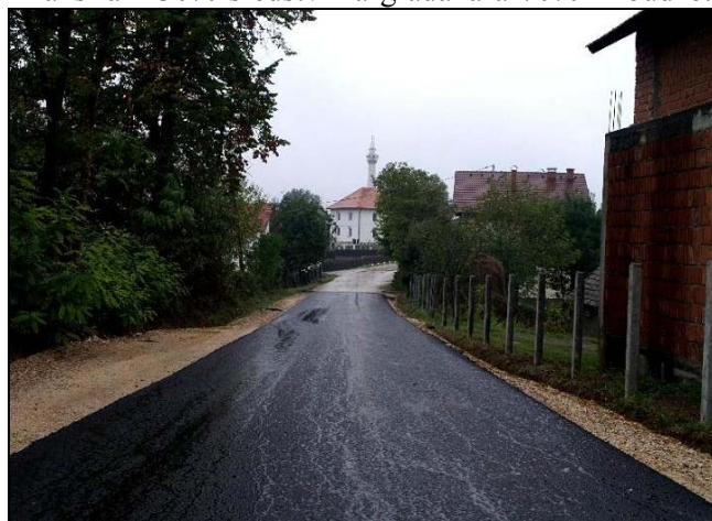
Asfaltirana preostala dionica puta Mustafići-Čehaje

Nakon što je prethodnih mjeseci urađena kvalitetna priprema podloge i odvodnje površinskih voda, izvođač radova firma «Zvornik putevi» d.o.o. Sarna je, zahvaljujući angažmanu većeg broja vlastite moderne mehanizacije kao i sopstvene asfaltne baze, sredinom ove sedmice, u vrlo kratkom vremenskom periodu, uspjela asfaltirati preostalu dionicu puta Mustafići-Čehaje, u dužini od oko 1200m, vrijednosti oko 110.000 KM, te konačno spojiti ovaj put sa postojećim asfaltnim putem kroz Čehaje. Prethodno su, sredinom aprila 2007.g., završeni radovi na modernizaciji i asfaltiranju prve dionice puta od Mustafića ka Čehajama, dužine 1000m, širine 3m i ukupne vrijednosti izvedenih radova preko 65.000 KM. Navedeni radovi na asfaltiranju ukupno oko 2200m navedenog puta, u šta je utrošeno oko 175.000 KM su finansirani 30% sredstvima građana a 70% iz budžeta