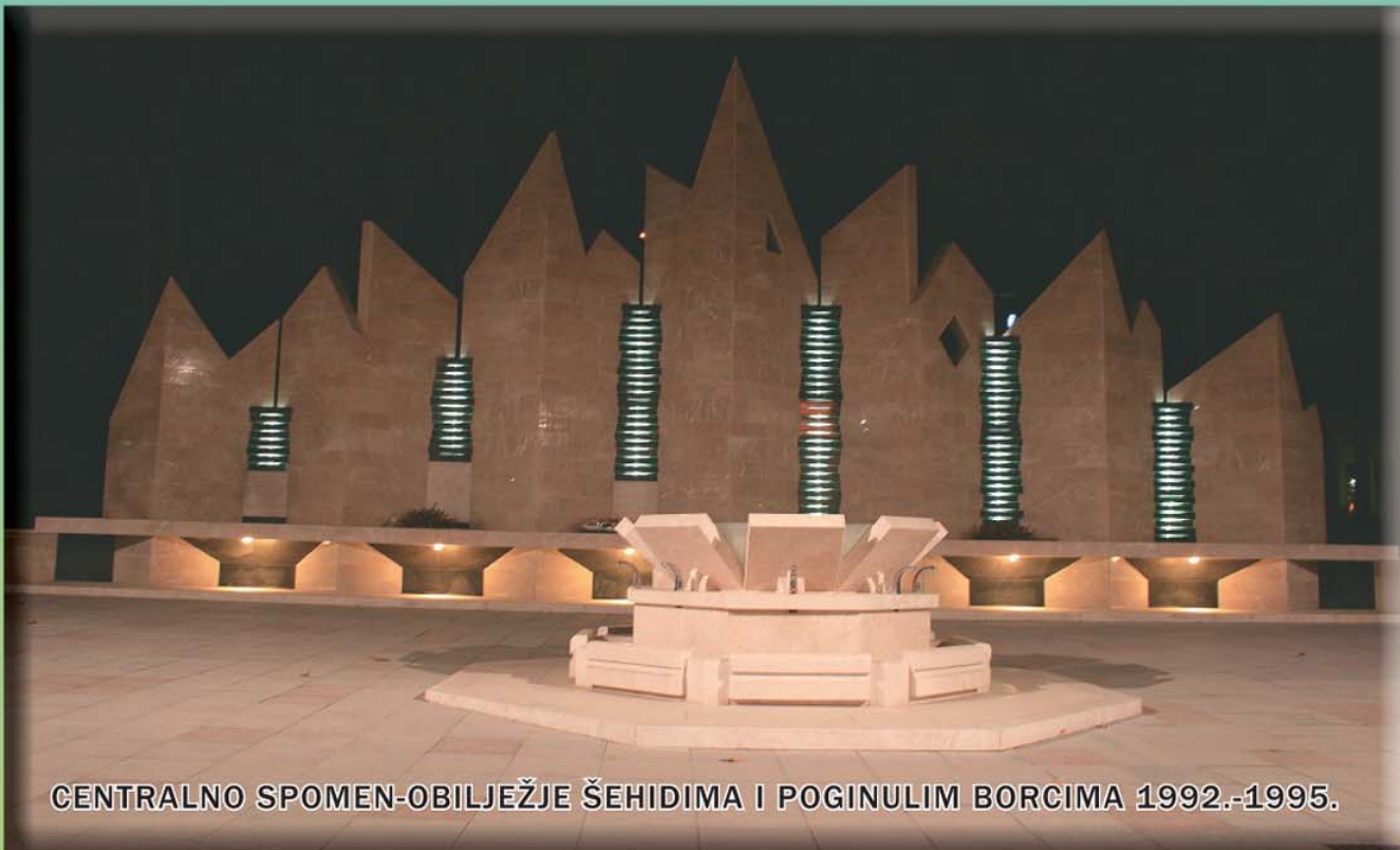
CENTRALNO SPOMEN-OBILJEŽJE ŠEHIDIMA I POGINULIM BORCIMA 1992.-1995.