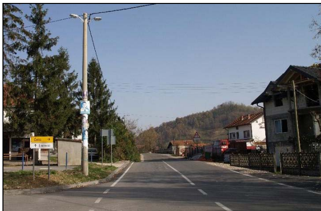
Sanirana dionica puta Previle-Čelić od 2 km

Nedavno su završeni radovi na sanaciji i rekonstrukciji regionalnog putnog pravca Previle - Čelić. Veoma oštećeni i frekventni putni pravac, do sada je bio prava noćna mora za vozače ali i pješake, tako da je Vlada TK-a, uz pomoć Federalne direkcije za ceste i manjim dijelom Općine Srebrenik, odlučila izdvojiti znatna finansijska sredstva za kompletnu sanaciju ovog puta u dužini od oko 2.000 metara. U prvoj fazi asfaltiranja regionalnog puta Previle - Čelić, radnici brčanske firme "Eko-prom", završili su potpunu rekonstrukciju puta na dionici od Previla do raskrsnice u Podorašju. Da se radi o ozbiljnom projektu i investiciji od blizu milion KM vidljivo je na svakom koraku. Novi asfaltni put je širok 6 metara, na jednom dijelu su urađeni trotoari, zatim novi most kod pumpne stanice vodovoda za Podorašje, postavljeni su metalni branici na svim opasnim mjestima, urađena je horizontalna i vertikalna signalizacija..., a do kraja godine duž većeg dijela izgrađene trase puta bi trebala biti urađena i savremena javna rasvjeta, projekat vrijednosti 42.000 KM, koji će podjednako financirati Općina Srebrenik i mještani MZ Podorašje. Na taj