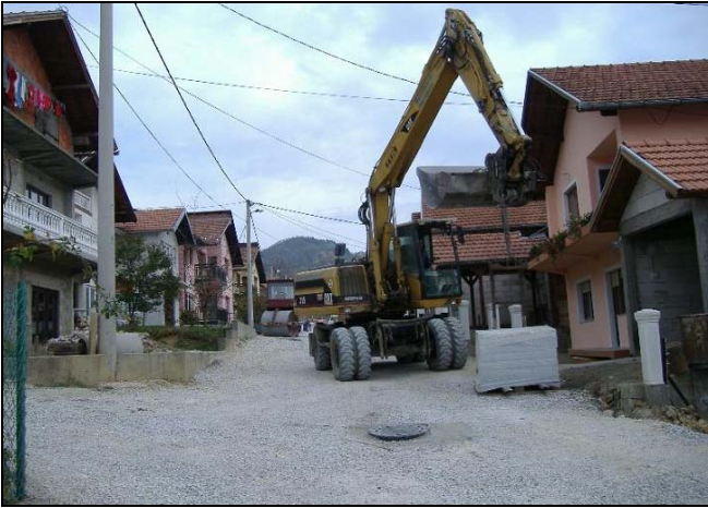
Naselje Neum bit će spašeno od klizišta

Naselje Neum u Srebreniku, koje se nalazi u blizini Druge osnovne škole, nedavno je pretvoreno u pravo gradilište. Naime, radnici firme «ITK Musić» d.o.o. Srebrenik, već nekoliko sedmica intenzivno rade na izgradnji odvodnih kanalizacionih krakova, zatim pripremanju podloge za polaganje asfalta kao i postavljanju ivičnjaka za uređenje trotoara. Riječ je o glavnoj ulici u ovome naselju dužine oko 1.000 metara i širine 3,5 metra kao i niz sporednih ulica koje će dobiti jednu sasvim novu dimenziju te bolji i ljepši izgled. Uz to, najveći značaj ovog projekta je taj što će se umnogome zaustaviti nestabilna padina koja je ozbiljno prijetila građanima ovoga naselja. U pitanju je projekat vrijedan blizu 2 miliona maraka, a u ovu prvu fazu iz budžeta Općine Srebrenik je investirano 255.000 KM.