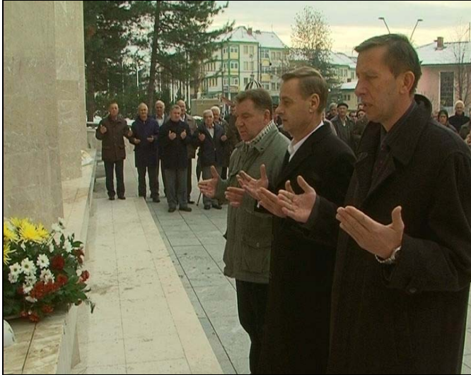
Polaganje cvijeća borcima i šehidima na Centralnom spomen-obilježju