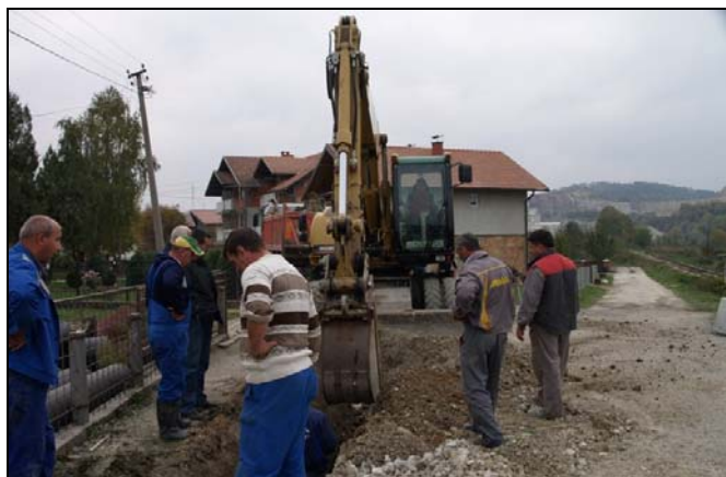
Detalj sa rekonstrukcije ulice Tuzlanskog odreda

Radnici firme «Road-ing» d.o.o. Gračanica, uveliko izvode radove na rekonstrukciji ulice Tuzlanskog odreda od tržnog centra «Bingo» do raskrsnice za Kiseljak, u gradskom području Srebrenika. -Vrijednost navedenih radova, sa rekonstrukcijom raskrsnice za Kiseljak, je oko 577.000 KM, a obzirom da je u pitanju zona gradskog građevinskog zemljišta, kompletni radovi će se financirati iz sredstava rente iz budžeta Općine Srebrenik. Početkom sljedeće godine sa početkom građevinske sezone će se pristupiti i rekonstrukciji raskrsnice sa Magistralnim putem kod tržnog centra «Bingo». Paralelno sa ovim radovima odvijali su se i radovi na rekonstrukciji puta Seona-Rašljeva u dužini od oko 1.000 metara, koje je izvela firma «ITK-Musić» d.o.o. Srebrenik. Radi se o investiciji od oko 132.000 KM koja se financira iz budžeta sa 70% sredstava, dok će ostalo obezbijediti građani, a značajna je zbog toga što se ovim putem uspostavlja znatno bolja i brža komunikacija sa susjednim općinama Gračanica i Lukavac, ističe općinski načelnik Osman Suljagić.