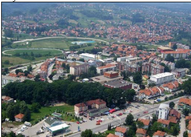
Srebrenik će se i dalje razvijati

- U oblasti proizvodnih, uslužnih i drugih djelatnosti, mi imamo određene projekte. Prije svega posebno ćemo se usmjeriti na pronalaženje prostora za uspostavljanje poslovnih zona. Te poslovne zone prije svega moraju biti na društvenom zemljištu, a mi smo Općina koja ima vrlo malo društvene zemlje, za razliku od općina iz našeg okruženja i tu smo u deficitu u odnosu na njih. Mi ćemo se usmjeriti na naše domaće investitore i nastojati njima pomoći kako bi ostvarili svoje projekte. Mi očekujemo da će već 2009. godine «Kopex», «Sinbra», «Marković», «Omega» ...započeti sa realizacijom svojih projekata, a, već smo obavili neke razgovore i sa onima koji žele uspostaviti svoje proizvodne kapacitete na području općine Srebrenik, a uveliko teku razgovori sa predstavnicima «Binga» da se u okviru «Corn-Flipsa» u Babunovićima pokrene jedan proizvodni pogon koji bi zaposlio jedan veći broj radnika.