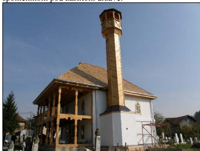
Restaurirana džamija u Špionici

Odlukom Komisije za zaštitu kulturno-historijskih spomenika BiH, Stara džamija sa haremom u Špionici Donjoj kod Srebrenika, dobila je status nacionalnog spomenika pod zaštitom države. Riječ je o jednom od najstarijih objekata u BiH, koji je, uprkos brojnim sanacionim radovima, zadržao svoj autentičan izgled. Prema istraživanjima prof. Edina Mutapčića naselje Špionica se u pisanim historijskim izvorima prvi puta spominje u 15. vijeku, a džamija je, kako se pretpostavlja, sagrađena u prvoj polovini 17. vijeka. Osnova munare je od kamena i drveta a u novije vrijeme je presvučena metalnim limom, što se konzervatorskim radom uklonilo, čime je munari vraćen prvobitan izgled. Noseći zidovi samog objekta su od kamena debljine 90 cm., a posebno je interesantna obrada drveta u unutrašnjosti džamije, na minberu i ćursu. U haremu džamije nalaze se veoma stari nišani sa stiliziranom obradom i natpisima na arapskom jeziku iz 17. vijeka, koji su također proglašeni nacionalnim spomenikom pod zaštitom države.