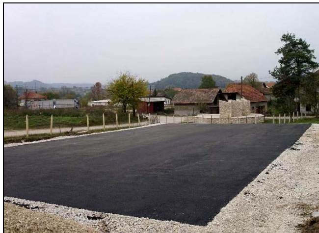
Poligon u Čehajama

U Čehajama je u dvorištu područne škole nedavno završena izgradnja sportskog poligona dimenzija 30x15m, koji je nakon pripreme terena, iskopa, temeljenja, betoniranja i izrade odvoda za odvodnju površinske vode i drugih grubih građevinskih radova, asfaltiran a ovih dana se vrši kompletno zatvaranje poligona sa svih strana metalnom ogradom visine 4 metra i plastificiranom žicom, kako se ne bi oštetila fasada i prozori obližnje područne škole i spomen-obilježje u Čehajama. Za navedeni poligon Općina Srebrenik je iz budžeta izdvojila oko 30.000 KM. Od izvođača radova smo saznali da će se ovaj poligon moći i zaključati, te na taj način spriječiti nelegalno korištenje, kao i osvijetliti sa obližnje škole za korištenje noću i organizovanje noćnih turnira u malom nogometu. Ista firma također je nedavno završila istovjetan sportski poligon, kod područne škole u Kugama, za šta je Općina Srebrenik iz budžeta izdvojila 23.000 KM.