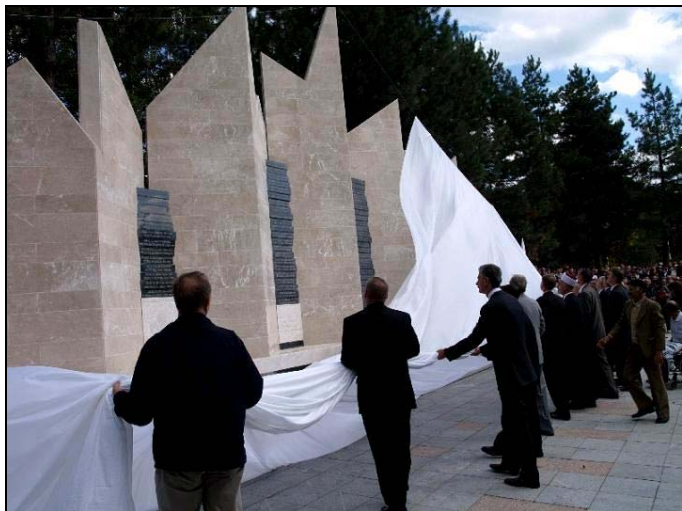
Trenutak otvaranja Centralnog spomen-obilježja

Izgovarajući 224 imena onih koji su položili svoje živote za odbranu Bosne i Hercegovine, 02.10.2008.godine je na centralnoj manifestaciji obilježavanja Dana šehida za područje TK-a, otvoreno Centralno spomen-obilježje šehidima i poginulim borcima-braniteljima sa područja općine Srebrenik u proteklom ratu. Ulica Alije Izetbegovića, koja je odnedavno pretvorena u Pješačku zonu, svakodnevno će nas podsjećati na sinove Bosne koji su položili svoje živote, kako bismo mi danas slobodno koračali našom domovinom.