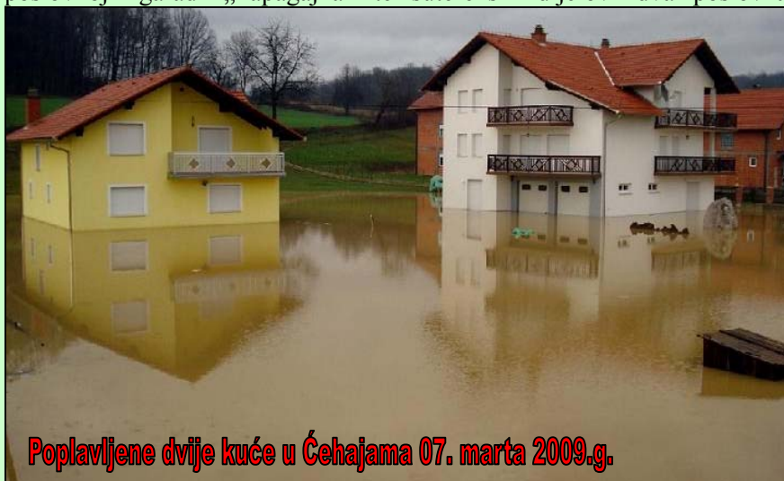
Poplavljene dvije kuće u Čehajama 07. marta 2009.g.

Umjesto da se pripremaju za proslavu 8. marta, Dana žena, brojni Srebreničani su jutarnje sate proveli u borbi sa vodenom stihijom. Naime dana, 07.03.2009 godine u jutarnjim satima, nakon obilnih padavina tokom noći, došlo je do izlivanja rijeke Tinje i njenih pritoka iz korita na više mjesta, kom prilikom je ugrožen veći broj stambenih i pomoćnih objekata, posebno u naseljenom mjestu Špionica Centar i Čehaje. Pravovremeno reagujući, Općinski štab civilne zaštite je istog dana u 10,30 sati održao vanrednu sjednicu Štaba i donio zaključke da se, u cilju kontinuiranog praćenja stanja na terenu i koordinacije djelovanja sa predstavnicima PS Srebrenik, MZ-a i građanima, nekoliko timova Štaba uputi na teren i to u pravcu Previla, Špionice i Ormanice. Osim što je poplavljeno nekoliko desetina hektara obradivog poljoprivrednog zemljišta duž plavnog pojasa rijeke Tinje, poplavljena su djelimično i dva stambena objekta u naselju Čehaje, kod poslovnog objekta «Cobra», te nekoliko kuća i pomoćnih objekata, kao i objekt PTT-a, u Špionici Centar. U samom centru grada, usljed nemogućnosti oticanja oborinskih i otpadnih voda, poplavljene su podrumske prostorije u stambeno-poslovnoj zgradi „Papagajka“ te suterenski dijelovi dva poslovna