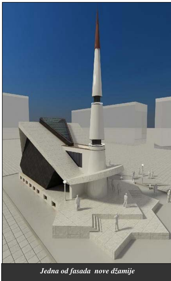
Jedna od fasada nove džamije

Na 3. sjednici OV-a Srebrenik, održanoj 27.12.2008.g., usvojen je rebalans budžeta za 2008. godinu. Prema riječima načelnika Općine Srebrenik, Osmana Suljagića, do sada je realiziran budžet blizu 11,5 miliona KM, te da on ipak ne bi trebao biti u deficitu, uprkos svim poteškoćama. Također, zbog neusvajanja budžeta za 2009.g., kao i u većini općina ide se na privremeno finansiranje za prva tri mjeseca, što je i predviđeno Zakonom o budžetu. Ipak, najviše rasprave