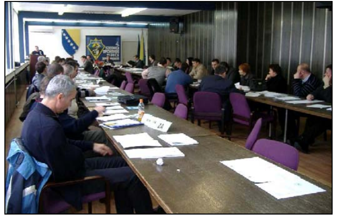
Sa 4. sjednice OV-a Srebrenik

Na četvrtoj sjednici Općinskog vijeća Srebrenik, koja je održana 31.01.2009.godine, usvojeni su programi rada Općinskog vijeća i Općinskog kasni sa implementacijom izbornih rezultata za dodjelu mandata vijećnicima u mjesnim zajednicama, i ova točka načelnika za 2009.godinu, kao i Odluka o subvenciji troškova naknada za dodijeljeno građevinsko zemljište za lica iz reda boračkih kategorija. S obzirom da se već