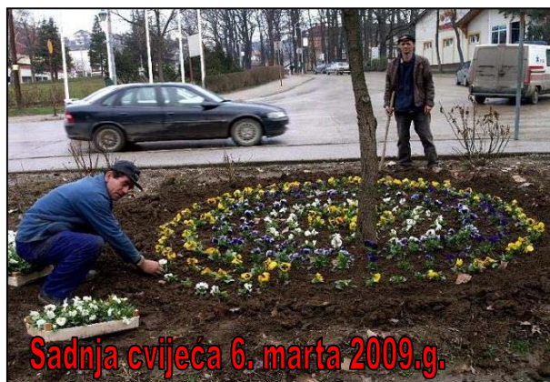
Sadnja cvijeća 6. marta 2009.g.