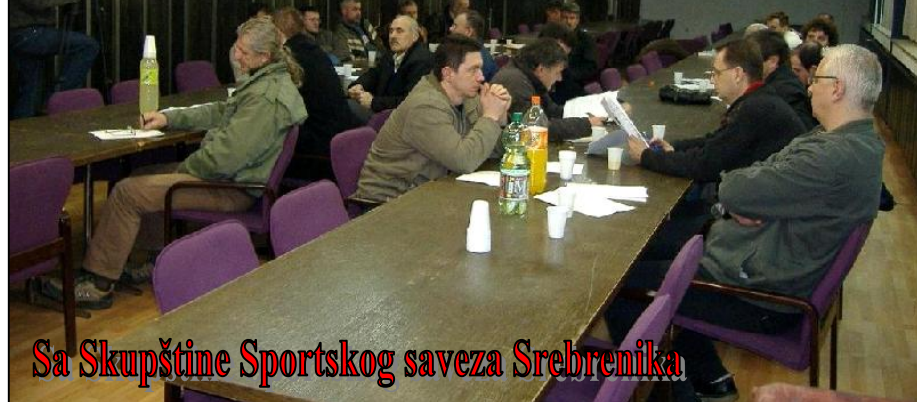
Sa Skupštine Sportskog saveza Srebrenika