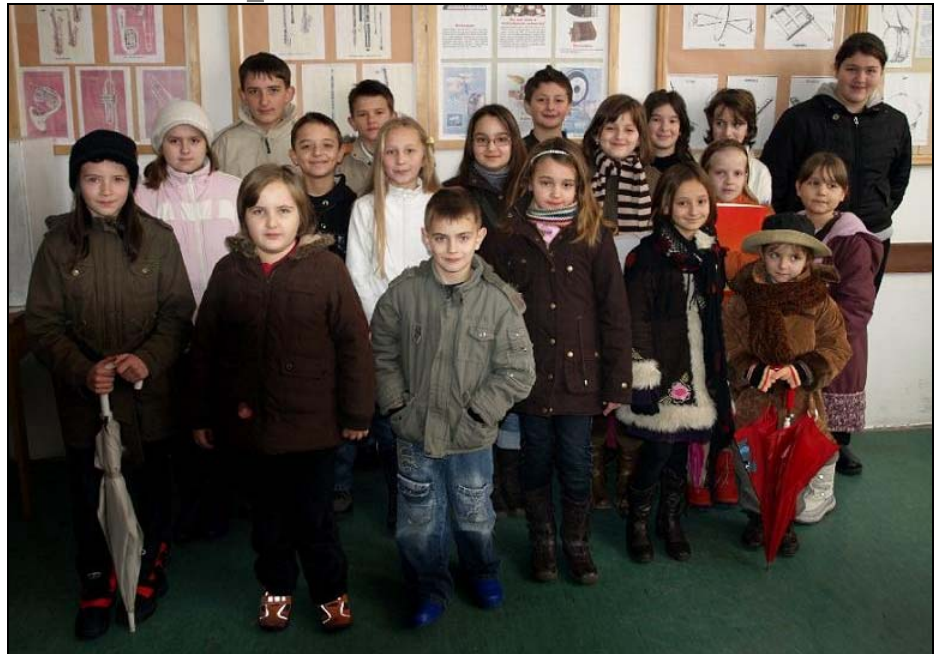
Dio polaznika odjeljenja Muzičke škole u Srebreniku