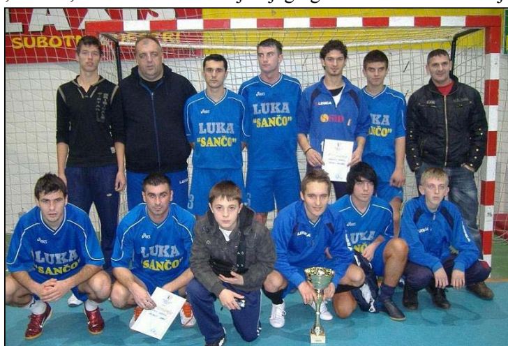
Ekipe "Luka-Sančo"- pobjednik Božićnog turnira