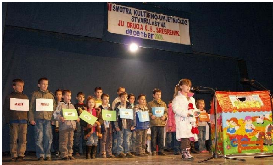
Najmlađi učenici su pobrali najviše aplauza

Dana 30.12.2008.godine, u kino-sali Centra za kulturu i informisanje u Srebreniku, održana je 2. smotra kulturno-umjetničkog stvaralaštva učenika Druge osnovne škole Srebrenik. Pred oko 600 posjetilaca, učenici predvođeni učiteljima i nastavnicima, su predstavili veoma bogat i raznovrstan program.