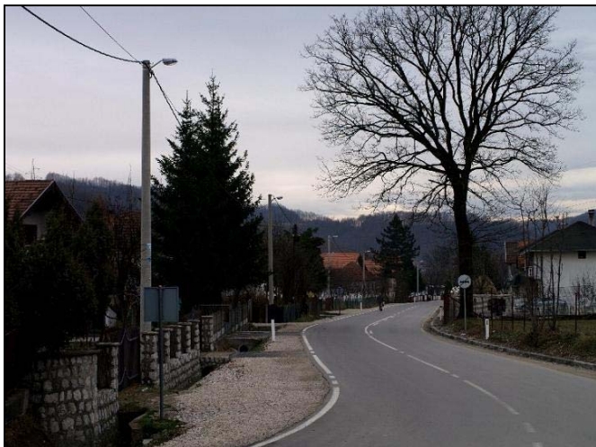
Veći dio javne rasvjete je već izveden