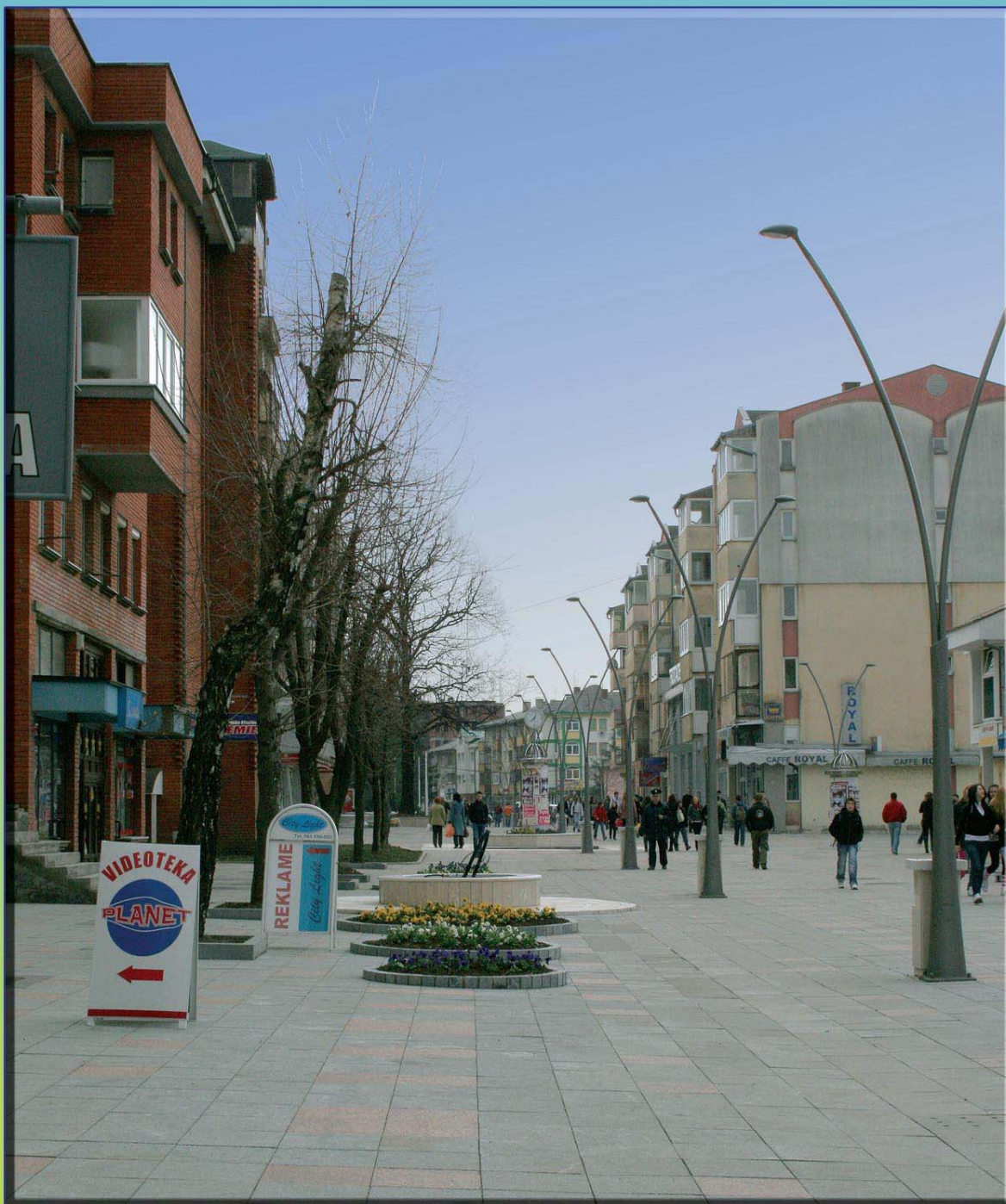
PJEŠAČKA ZONA U SREBRENIKU

IZDAJE: OPĆINA SREBRENIK • BROJ: 27 • MJESEC: MART/OŽUJAK 2009. • BILTEN JE BESPLATAN • TIRAŽ 500