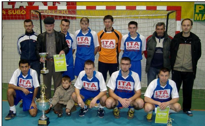
Ekipe "Ita-Woolf"- pobjednik Bajramskog turnira