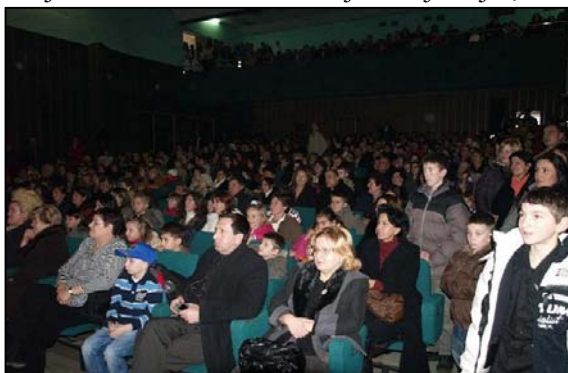
Zadovoljni gledaoci su ispunili Kino salu

zadovoljna lica roditelja, nana i djedova, koji su, «naoružani» fotoaparatom i video kamerama, pratili i ovjekovječavali svaki korak svojih majmilijih, a o radosti učenika koji su nastupali ne treba ni govoriti. Na kraju, zašto ne napomenuti da su brojni roditelji, osim zadovoljstva viđenim, smatrali da je cijena karte ipak previsoka, jer roditelji i onako moraju platiti garderobu, rekvizite, kostime... za nastup svoje djece, te da menadžment škole ubuduće i o tome treba više voditi računa.