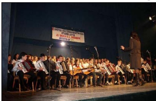
Nastup hora i orkestra Druge OŠ

«ovo je i tradicionalna, druga po redu, donatorska smotra, s obzirom da će svi prisutni, kupovinom karte od 3 KM, pomoći menadžmentu škole u kupovini neophodnih nastavnih sredstava, knjiga i učila. Da je smotra u potpunosti uspjela, osim prepune kino sale, govore i