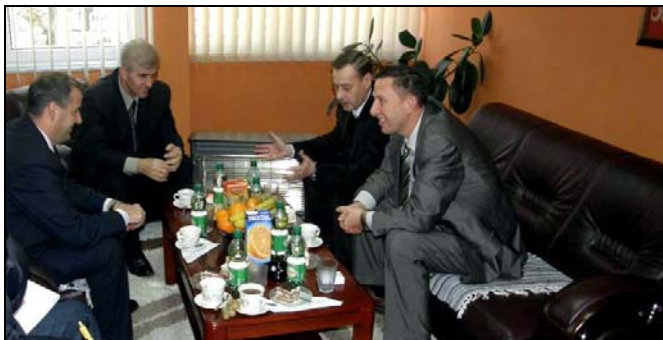
Načelnik i predsjedavajući OV na prijemu u novoj zgradi Medžlisa IZ Srebrenik