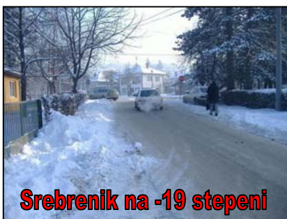
Srebrenik na -19 stepeni

Srebrenik je 09.01.2009. g. osvanuo u «debelom minusu», a izmjerena je temperatura od čak -19 stepeni, što nije zabilježeno u posljednjih nekoliko godina na ovom općinskom području. Mnogi naši sugrađani su imali poteškoća sa paljenjem svojih dvotočkaša,