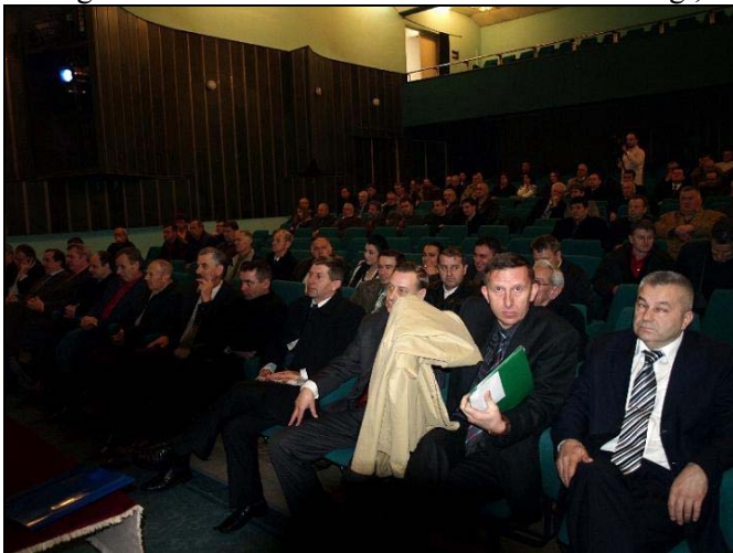
Sa svečane akademije održane povodom 1. marta, Dana nezavisnosti BiH

Položeno je cvijeće na i Centralno spomen-obilježje prisustvovali su predstavnici Vlade TK i poslanici u Parlamentu FBiH, vijećnici Općinskog vijeća Srebrenik, predstavnici boračkih udruženja, privrednih kolektiva i javnih ustanova s područja srebreničke općine, te predstavnici medija. Na početku obilježavanja ovog datuma, delegacija Općine Srebrenik i boračkih udruženja, položila je cvijeće na Centralno spomen-obilježje poginulim borcima s područja općine Srebrenik u odbrambeno-oslobodilačkom ratu 1992-1995.g i narodno-oslobodilačkom ratu 1941-1945.g., te