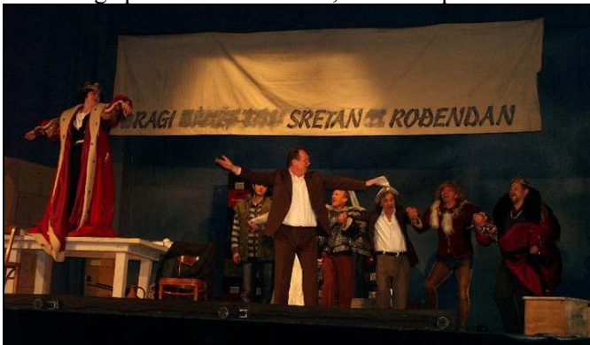
Sa predstave «Hamlet u selu Mrduša Donja»

Srebrenik, poznat kao «Gradina», trebao bi u skorije vrijeme da postane prepoznatljiv turistički proizvod, koji bi trebao pokrenuti i ostale potencijale. Stari Grad je simbol Srebrenika, a nema sumnje da će nakon njegove potpune restauracije postati pravi turistički centar, ne samo Srebrenika, nego Tuzlanskog kantona pa i cijele BiH. Vlasnici Grada Srebrenika su bili banovi i kraljevi srednjovjekovne bosanske države iz dinastije Kotromanića. «Predstava Hamleta u selu Mrduša donja» Narodnog pozorišta iz Tuzle, rađena po tekstu Ive