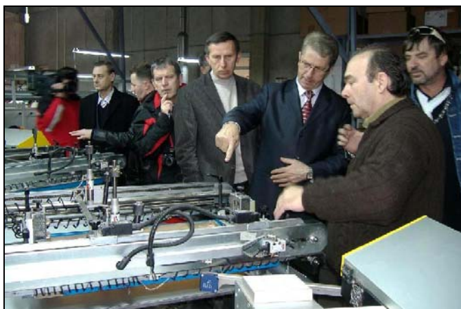
Vlada TK-a će pomagati razvoj općine Srebrenik