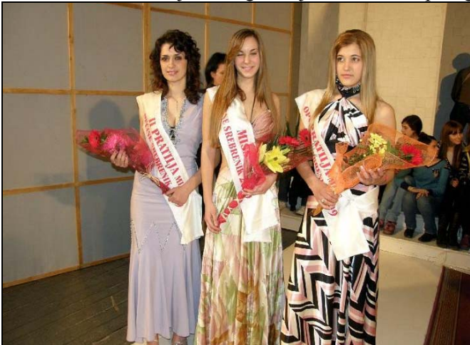
Miss Srebrenika sa prvom i drugom pratiljom

od kojih je njih sedam izborilo pravo učešća na manifestaciji izbora Mis TK-a. Odlukom stručnog žirija Miss Srebrenika je 16-godišnja učenica prvog