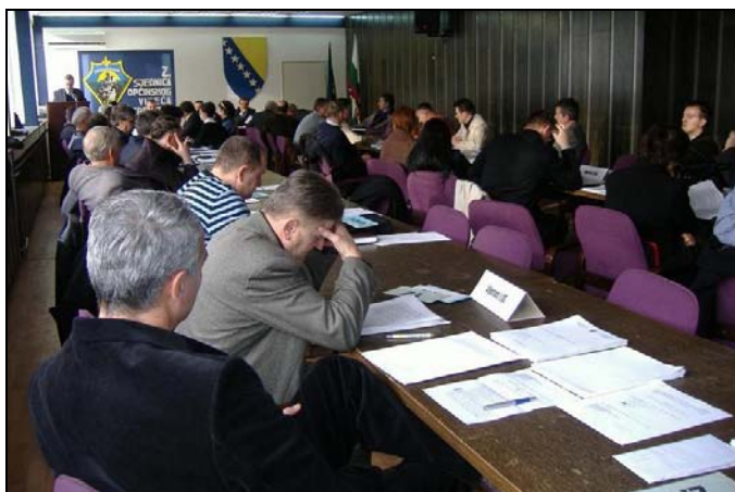
Sa 2. sjednice OV-a Srebrenik