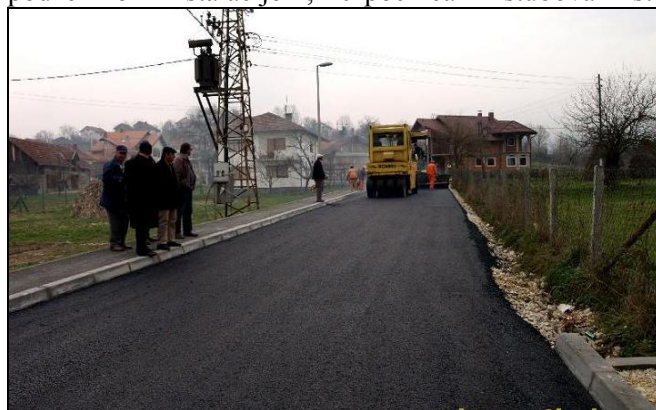
Sa asfaltiranja ulice u naselju Čehaje