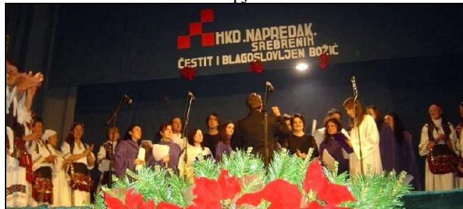
Sa Božićnog koncerta u Srebreniku

U prepunoj Kino-sali srebreničkog Centra za kulturu i informisanje, u nedjelju 21.12.2008. godine, održan je tradicionalni Božićni koncert u organizaciji Hrvatskog kulturnog društva «Napredak» Srebrenik. Srebreničkoj publici predstavio je se hor «Iventus Salinarium» zbora mladih pri Franjevačkom samostanu u Tuzli, pod dirigentskom palicom Zlatka Špoljarevića. Oni su izveli 17 božićnih pjesama u obradi Čedomira