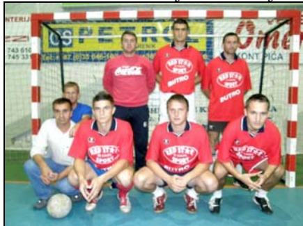
Pobjednička ekipa Lisovića

U Dubokom Potoku kod Srebrenika završena je Četvrta ljetna