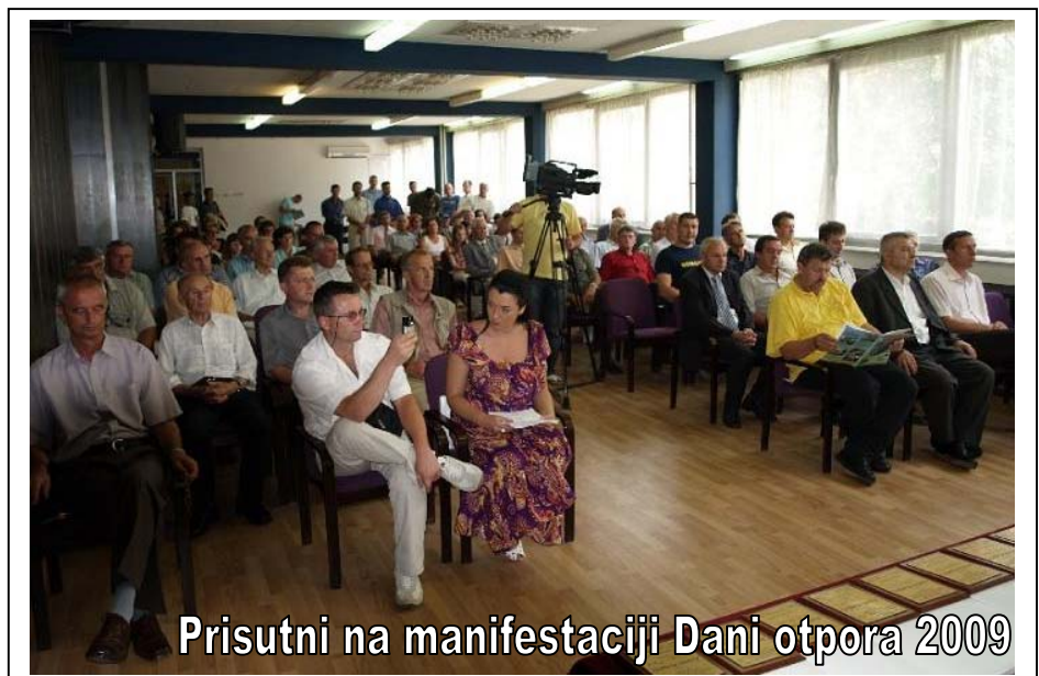
Prisutni na manifestaciji Dani otpora 2009

naš odnos prema izgrađenim spomen obilježjima i herojima koji su dali svoj život za BiH, je najblaže rečeno neadekvatan i to se mora mijenjati, a ovakvi i drugi slični skupovi i služe u tu svrhu. Na završnom skupu manifestacije „Dani otpora općine Srebrenik“, koji je održan u prepunoj Plavoj Sali Doma kulture, nakon prigodnih referata, zaslužnim pojedincima i kolektivima te najboljim iz sportskih natjecanja, koja su održana povodom Dana otpora, su dodijeljena priznanja.