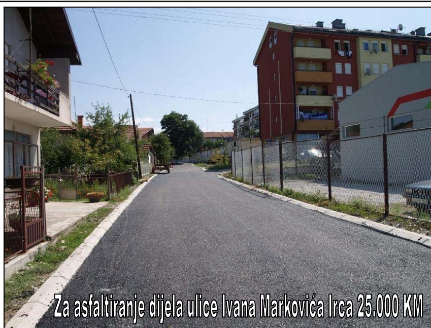
Za asfaltiranje dijela ulice Ivana Markovića Irca 25.000 KM

Dana 12.08.2009. godine, polaganjem završnog asfaltnog sloja, radnici firme „Stenlir“ d.o.o. Živinice su završili radove na modernizaciji dijela ulice Ivana Markovića Irca u C. Srebrenika, odnosno jednog njenog kraka pored zgrada zv. Sekvoja i Poljostroj. Radi se o dionici dugoj preko 100m, prosječne širine oko 5m, za čiju je izgradnju iz budžeta općine Srebrenik izdvojeno 25.000 KM. Na ovaj način je i ova ulica dobila znatno savremeniji izgled. Za naredne godine predviđeni su radovi i na modernizaciji puta za Čehaje, pored bivšeg Poljostroja.