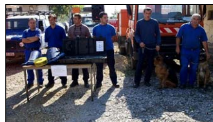
Tim za uklanjanje NUS-a se osigurala njena mobilnost.

objektima. -Osnovna djelatnost Gorske službe bit će pružanje pomoći ljudima u planinama, nepristupačnim predjelima, liticama, kanjonima, visokim objektima, tunelima, cijevima, saobraćajnim nesrećama, skijalištima, penjalištima, speleološkim objektima..., kazao je šef Službe civilne zaštite, Bajro Imširović. Ipak, da bi entuzijizam ovih hrabrih pripadnika Gorske službe bio stavljen u funkciju, bit će potrebno izvršiti obuku i osposobljavanje ove ekipe. Zatim bit će potrebno nabaviti i dodatnu zaštitnu opremu poput vjetrovki, zimske odjeće, šatora, užadi, planinskih čekića, dok će biti potrebna i nabavka jednog terenskog motornog vozila kako bi