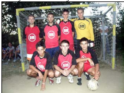
Ekipa DM Čifluk

Dana 17.08.2009.godine, na sportskom poligonu u Babunovićima, odigran je Memorijalni turnir u malom nogometu u znak sjećanja na šehide i poginule borce iz ovog naselja. Na turniru je učestvovalo 18