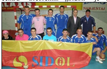
Pobjednička ekipa Sidoila

Ekipa „Sidoila“ pobjednik je 6. Radničkih igara – Srebrenik 2009, koje su se tokom juna održavale u „Sportsko-rekreativnom centru“ Srebrenik. „Sidoil“ je u