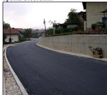
Sa rekonstrukcije reg. puta

imovinsko-pravnih odnosa sa vlasnicima zemljišta, gdje je trebalo doći do proširenja puta, što je i usporilo radove, na pojedinim opasnim krivinama širina kolovoza iznosi i do 9 metara, a urađeni su i brojni potporni zidovi, pješačka staza i kolektor za odvodnju površinskih voda. Vrijednost radova, koji bi se u potpunosti trebali okončati do trenutka izlaska iz štampe ovog Biltena, iznosi preko 470.000 KM, a sredstva su osigurali općina Srebrenik i Direkcija za puteve Tuzlanskog kantona. Uporedo s rekonstrukcijom kolovoza, obavljani su i radovi na postavljanju podzemnih instalacija za javnu rasvjetu te izgradnji kanalizacije za dio naselja Luka. Vrijednost ovih radova je oko 100.000 KM, a sredstva je iz budžeta osigurala općina Srebrenik.