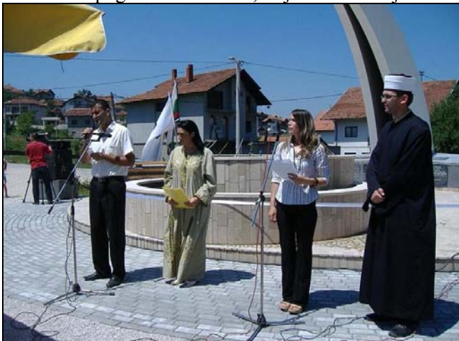
Sa otvorenja spomen-obilježja u D. Potoku

U okviru obilježavanja Dana općine Srebrenik, dana 19.06.2009.godine u naseljima Duboki Potok i Ljenobud, svečano su otvorena spomen-obilježja šehidima i poginulim borcima, koji su dali svoje živote