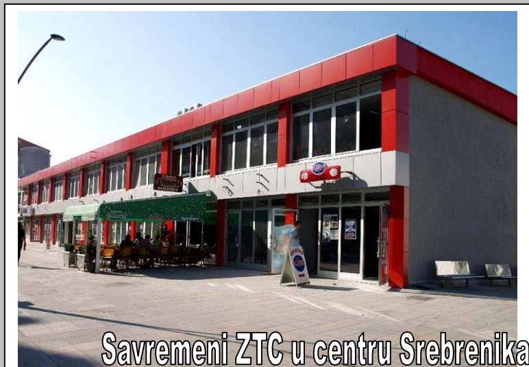
Savremeni ZTC u centru Srebrenika

Postavljanjem aluminijskih fasada realizirana je prva faza projekta proširenja i dogradnje zanatsko-tržnog centra u ulici Alije Izetbegovića u centru Srebrenika. Na osnovu idejnog rješenja, koje je usvojilo Općinsko vijeće Srebrenik, nakon demontiranja starog krova i rušenja pojedinih pregradnih zidova, vlasnici poslovnih prostora proširili su svoje objekte za dva metra prema šetalištu i nadzidali po jedan sprat. U realizaciju prve faze ovog projekta uloženo je oko 350.000 KM, a sredstva su osigurali vlasnici dograđenih poslovnih objekata.