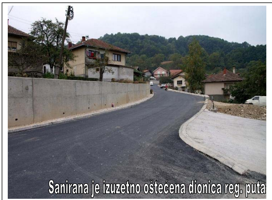
Sanirana je izuzetno oštećena dionica reg. puta

Radnici firme «Reveus» iz Lukavca, nakon višemjesečnih radova, krajem septembra 2009.g. završili su gotovo sve radove na proširenju i rekonstrukciji dijela reg. puta Srebrenik-Orahovica-Gračanica, na dionici od mosta u naselju Luka do raskrsnice na skretanju za naselje Brničani. U okviru projekta,