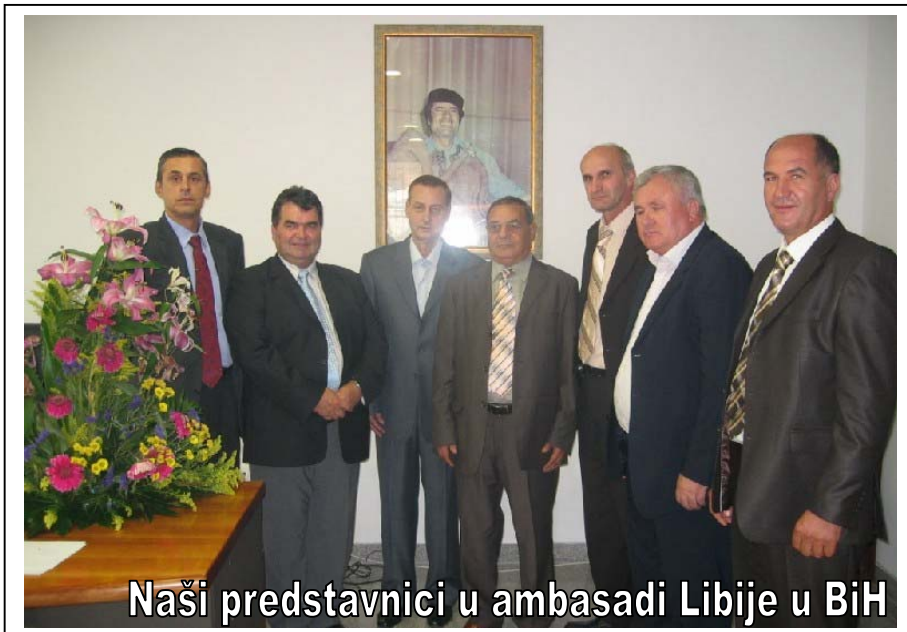
Naši predstavnici u ambasadi Libije u BiH

Dana 15.07.2009. godine, općinu Srebrenik je posjetio ambasador Libije u Bosni i Hercegovini, Ayad S.S. Shawish. Razlog posjete bio je upoznavanje sa prirodnim i privrednim potencijalima općine Srebrenik te razgovori o mogućem nastupu domaćih firmi na tržištu Libije, kao i mogućnost ulaganja Libije u razvoj infrastrukture općine Srebrenik. Ambasadora su u kabinetu načelnika primili načelnik Osman Suljagić i njegovi saradnici, nakon čega je održan i sastanak sa privrednicima u Plavoj sali Doma kulture. Na sastanku sa privrednicima razgovaralo se o mogućnosti formiranja konzorcija građevinskih firmi i njihovog nastupa na libijskom tržištu. - Naša posjeta ima za cilj da podržimo i ohrabrimo privrednike sa ovog općinskog područja i da im pružimo ruku za saradnju. Veliko mi je zadovoljstvo da ja kao ambasador Libije u BiH vidim bh. kompanije na libijskom tržištu, jer uspjeh bh. firmi u Libiji je i moj lični uspjeh. U Libiji ima mnogo posla za gotovo sve firme, posebno iz oblasti nisko-gradnje kao i visokogradnje, ali ponavljam da jedino kao konzorcij možete konkurisati. Udružite se i