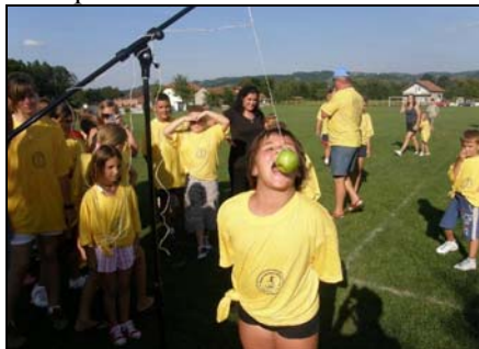
Sa 4. male seoske olimpijade

U organizaciji HKD "Napredak", dana 08.08.2009. godine, u Srednjoj Špionici kod Srebrenika, održana je Četvrta mala seoska olimpijada, na kojoj je nastupilo više od 100 takmičara.