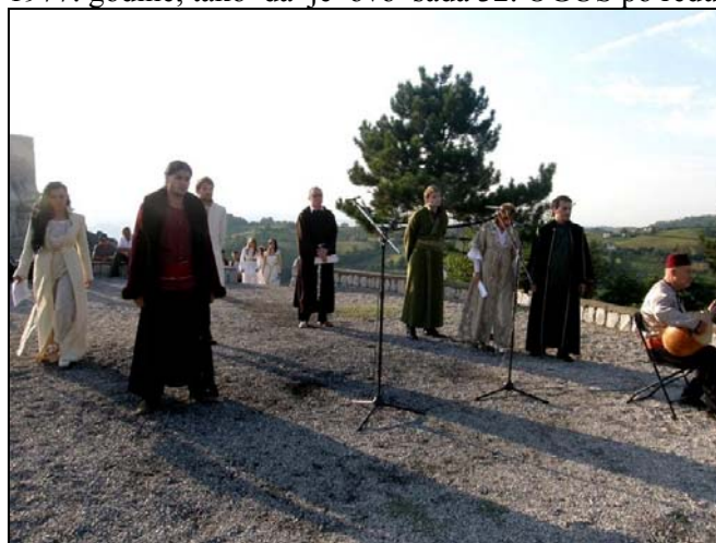
Detalj sa svečanog otvaranja OGUS-a 2009

manifestacija „Srebrenik-otvoreni grad umjetnosti“ (OGUS). Ova manifestacija održava se svake godine od 1977. godine, tako da je ovo sada 32. OGUS po redu.