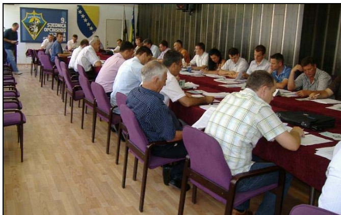
Sa 9. sjednice OV-a Srebrenik