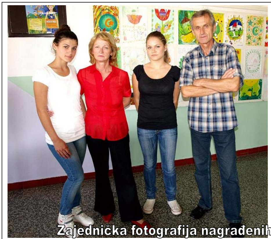
Zajednička fotografija nagrađenih

Ministarstvo kulture i sporta FBiH je u aprilu mjesecu 2009. godine, u sklopu programa „Mladi i naslijeđe 2009“ u okviru manifestacije „Dani evropskog naslijeđa“, raspisalo Konkurs za dostavljanje likovnih radova učenika osnovnih i srednjih škola. Tema konkursa je „Običaji iz mog kraja“ a sve je pokrenuto s ciljem da podstakne mlade na očuvanje, brigu i ljubav za kulturno-historijsko naslijeđe Bosne i Hercegovine. Na konkurs su se prijavile i naše dvije