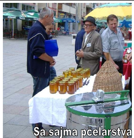
Sa sajma pčelarstva