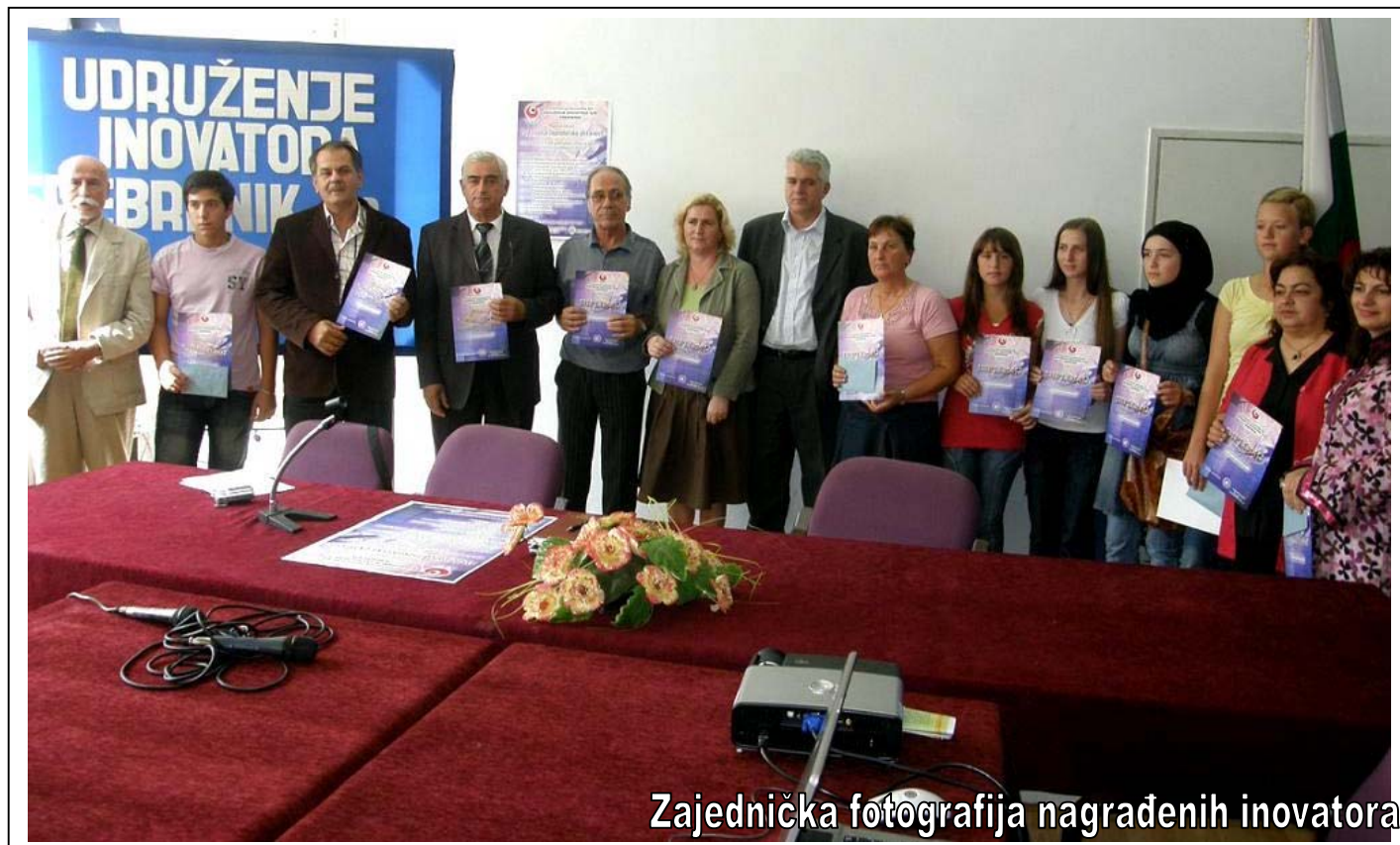
Zajednička fotografija nagrađenih inovatora