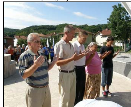
Proučena je fatiha i položeno cvijeće na spomen-obilježje šehidima u D. Potoku

0 : 0, pobijedila na penale ekipu NK „Mramor“ iz istoimenog mjesta rezultatom 4 :3, dok treće mjesto zauzela ekipa NK „Gradina“ iz Srebrenika, koja je rezultatom 1 :0