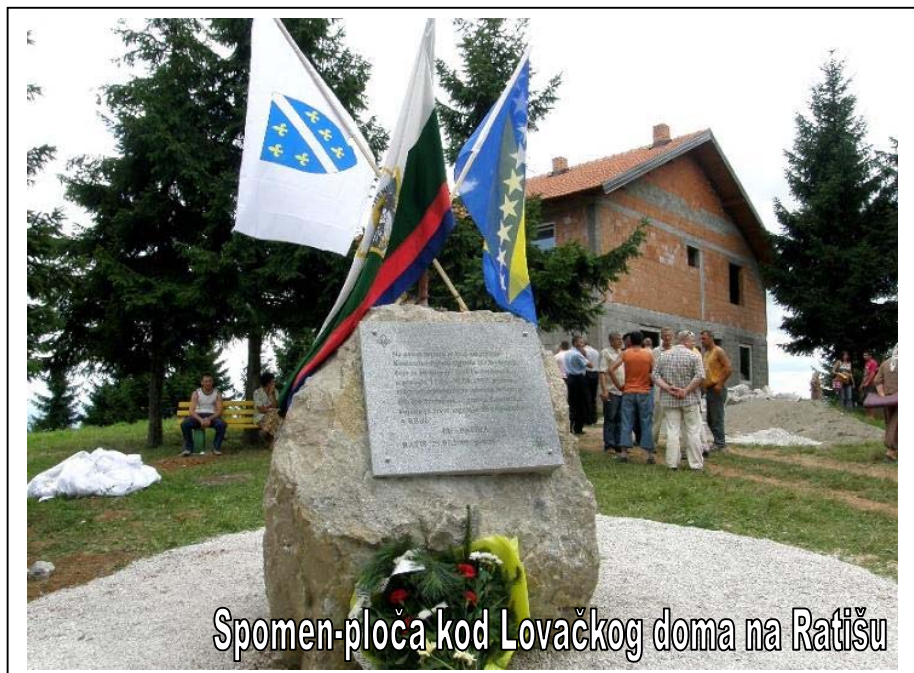
Spomen-ploča kod Lovačkog doma na Ratišu