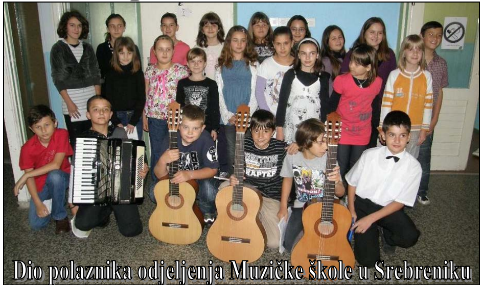
Dio polaznika odjeljenja Muzičke škole u Srebreniku