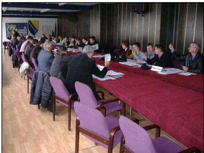
Sa 15. sjednice OV-a Srebrenik