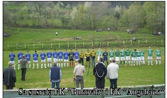
Sa susreta FK „Bukovik“ i FK „Angeback“