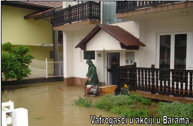
Vatrogasci u akciji u Barama

K iša, koja je nekoliko dana intenzivno padala krajem maja i početkom juna 2010.g. dana, prouzrokovala je velike poplave i klizišta na području kompletne općine Srebrenik. Od poplava su direktno bila ugrožena naselja uz korito rijeke Tinje, njenih pritoka i brojnih lokalnih potoka, tako da je