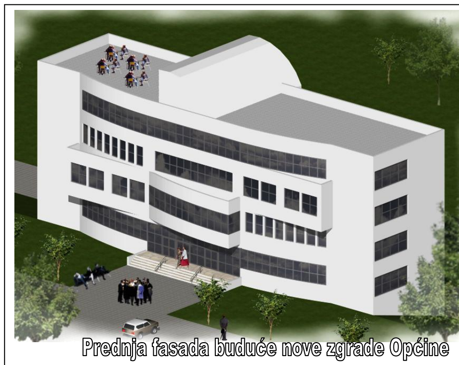
Prednja fasada buduće nove zgrade Općine

projekta je oko 4 miliona KM, a njegovom realizacijom konačno bi se riješio višegodišnji nedostatak adekvatnog prostora za općinske službe koje su sada smještene u neuslovnim prostorima-barakama na više različitih lokacija u gradu Srebreniku. Općina Srebrenik je već uradila i revidovala projektnu dokumentaciju i ima svoje zemljište, a finansijska sredstva bi se trebala osigurati putem povoljnog kredita Saudijskog fonda za razvoj u iznosu od 2,6 miliona dolara, s grejs periodom od 5 godina, rokom otplate od 20 godina i znatno manjom kamatom od one koju trenutno nude komercijalne banke na području Bosne i Hercegovine.