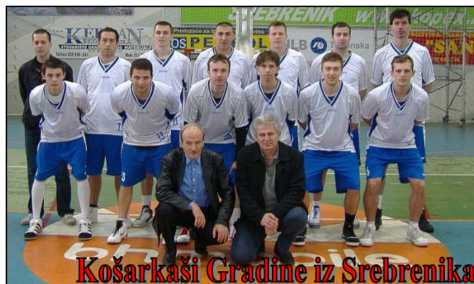
Košarkaši Gradine iz Srebrenika