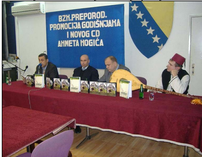
S promocije Godišnjaka BZK Preporod i CD-a Ahmeta Hogića

U prepunoj „Plavoj sali“ Centra za kulturu i informisanje Srebrenik, Bosanska zajednica kulture (BZK) „Preporod“ Srebrenik, promovisala je prvi broj „Godišnjaka“. Riječ je o javnom glasilu koji govori o 14 godina postojanja BZK „Preporod“ u Srebreniku, zatim historiji Bošnjaka kako na ovom području tako i u cijeloj BiH. Inače, o dosadašnjem radu ove zajednice nije postojao nikakav