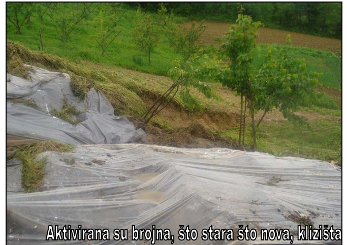
Aktivirana su brojna, što stara što nova, klizišta

mašina su na terenu rađeni prioritetni zahvati, kako bi se stanje kako tako poboljšalo ili bar zadržalo trenutno. Angažovani su i vatrogasci, koji su neprestano pumpama