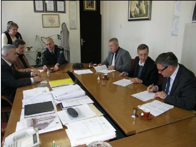
Sa potpisivanja ugovora

Načelnik Općine Srebrenik Osman Suljagić i ministar unutarnjih poslova u Vladi Tuzlanskog kantona Sead Omerbegović, dana 31.03.2010.g., potpisali su ugovore za 12 diplomiranih kriminalista, koji će od 01. aprila započeti sa obavljanjem pripravničkog staža u Policijskoj stanici Srebrenik. Ministarstvo unutrašnjih poslova TK dalo je saglasnost Općini Srebrenik za volontiranje 11 diplomiranih kriminalista, tj. za obavljanje pripravničkog staža. -Projekat je faktički počeo odmah, tako da su ovi mladi ljudi skinuti sa evidencije Biroa za