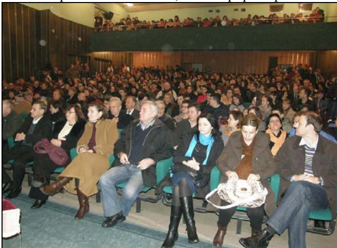
Predstava je privukla veliku pažnju Srebreničana

povelje 2010“, tematizira bitne i relevantne stvari današnjice na ozbiljan način. Urađena je s porukom koju osjeća kao deficit naše sredine – optimizam. On vjeruje da možemo sami promijeniti svoje živote vlastitim angažmanom, ne očekujući pravnu državu i ne okrivljujući društvo za loše živote. Tekst je vrlo precizno napisan, potpuno se bavi problemima današnjeg vremena koji su isti ili slični u BiH, Hrvatskoj ili drugdje. To je prvenstveno problem nepostojanja komunikacije i nemogućnosti da čujemo tuđe mišljenje. „Bajram je. Zeko je bivši branilac koji boluje od PTSP-a, i vlasnik je brijačnice na periferiji grada. Njegov brat Toni ima problematičan brak, a i voli popiti i prokockati.