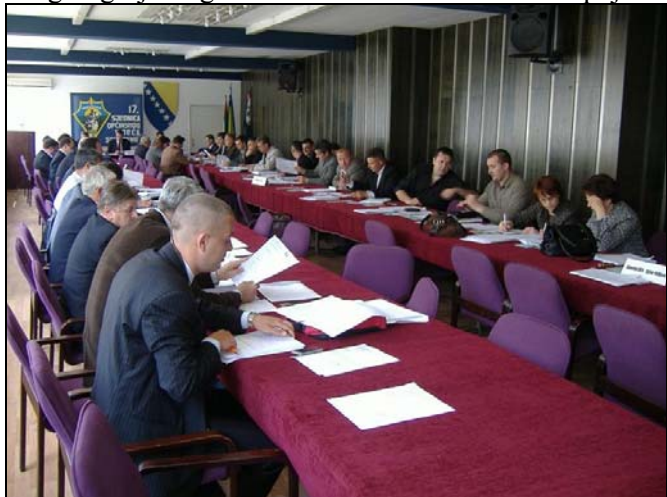
Sa 17. sjednice OV-a Srebrenik

N ajviše rasprave na 17. sjednici Općinskog vijeća Srebrenik, izazvala je tačka o Programu zaštite okolice na području općine Srebrenik, koji se odnosi na sakupljanje otpada, zaštitu voda, zraka, zemljišta..., ali s obzirom da je bila u nacrtu, o njoj će se još raspravljati na narednim sjednicama. Ipak, konstatovan je veliki problem što je svega 60% stanovništva uključeno u organizovani odvoz otpada, zbog čega je naglašeno kako se mora dodatno pojačati