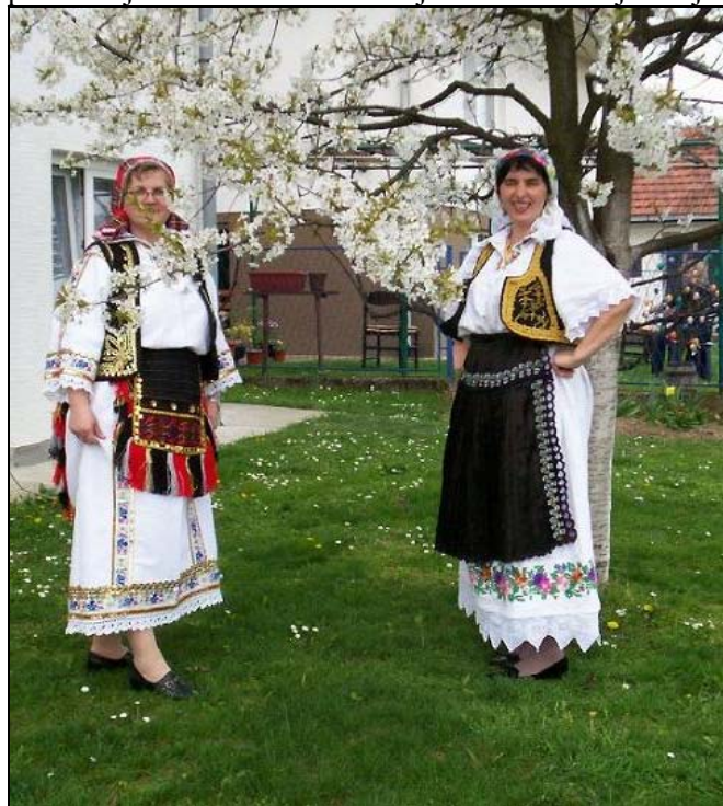
Sa proslave Uskrsa/Vaskrsa u Ceriku

Pravoslavni i katolički vjernici ove godine su istog dana proslavili Uskrs odn. Vaskrs. Uskrs/Vaskrs je najveći hrišćanski praznik kojim se slavi uskrsnuće Isusa Krista iz mrtvih i koji predstavlja suštinu hrišćanske vjere. Isus Krist je svojim