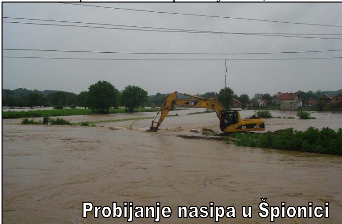
Probijanje nasipa u Špionici

najgore stanje bilo na području Špionice, Bara, Previla, Tinje i Dubokog Potoka, gdje su dvorišta brojnih kuća potopljena dok je u nekoliko porodičnih kuća ušla voda tj. podrumi ili prizemlja su bili poplavljeni. Na mjernoj letvi na rijeci Tinji na mostu u Barama, u jednom momentu je bila izmjerena visina od 3,8 metara, što je dosadašnji maksimum. Tim povodom održana je vanredna sjednica Štaba CZ Srebrenik, na kojoj su formirane ekipe koje su konstantno obilazile teren i dojavljivale promjene na terenu, a nakon što je, na prijedlog OpŠCZ Srebrenik, općinski načelnik Osman Suljagić donio Odluku o proglašenju stanja prirodne nepogode od poplava i klizanja tla na području općine Srebrenik, angažovana je Služba zaštite i spašavanja od rušenja, koja je sa svom mehanizacijom i ljudstvom izašla na terenu, ali obzirom na nedostatak mašina teško je bilo stići na sve strane. Na više lokaliteta su dovučeni pijesak i vreće, kako bi se pokušalo pomoći građanima da zaustave prodor vode u prizemlja kuća, sa nekoliko