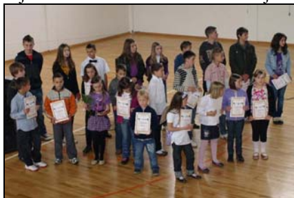
Nagrađeni učenici u Drugoj OŠ

u nastavnim i vannastavnim aktivnostima, uz obavezan bogat kulturno-zabavni program. Neke škole su se, pored uspjeha u nastavnim i vannastavnim aktivnostima, mogle pohvaliti i radovima na uređenju škole, dvorišta... Tako je svečano obilježen i Dan škole u JU OŠ „Tinja“ u Tinji, kom prilikom je otvorena prilazna staza za invalidne osobe, a po projektu kojega je realizirala JU OŠ „Tinja“ u saradnji sa Fondacijom tuzlanske zajednice i Međunarodnim udruženjem