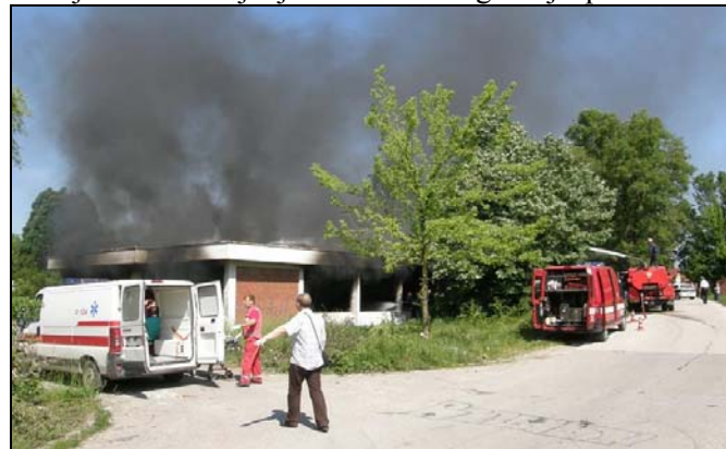
Sa pokazne vježbe u krugu bivšeg Interpleta

vatrogastvo. Prezentirano je i gašenje požara u „Dječijem obdaništu“, a za kraj su vatrogasci, u sadejstvu sa policijom i Hitnom pomoći, u krugu nekadašnje firme „Interplet“, izveli i jednu pokaznu vježbu. Upriličeno je i druženje vatrogasnih podmladaka iz Sarajeva, Tešnja i Srebrenika. Na poligonu malih sportova ispred „Prve osnovne škole“ mladi vatrogasci iz ova tri grada, demonstrirali su vježbe iz gašenja požara, čime su pokazali zavidan nivo znanja. –Ovo druženje organizirano je da mladi već sada počnu sa ozbiljnim razmišljanjem iz oblasti gašenja požara. Oni