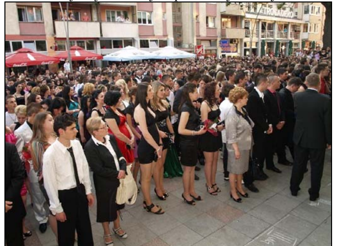
Brojni građani su pratili defile maturanata