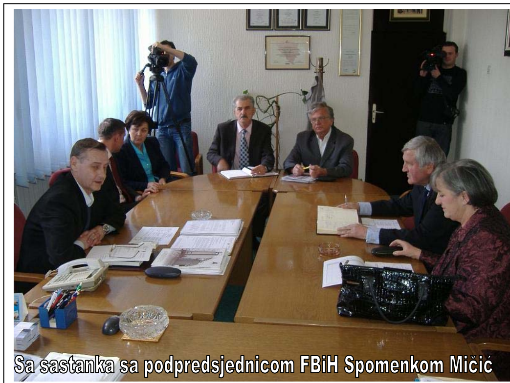
Sa sastanka sa podpredsjednicom FBiH Spomenkom Mičić