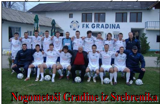
Nogometaši Gradine iz Srebrenika