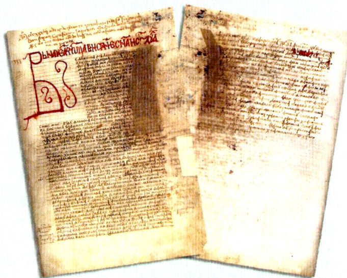
Povelja kojom bosanski ban Stjepan II Kotromanić 15. februara/veljače 1333. godine Dubrovačkoj Republici ustupa Rat, Ston, Prevlaku i otoke oko Rata.